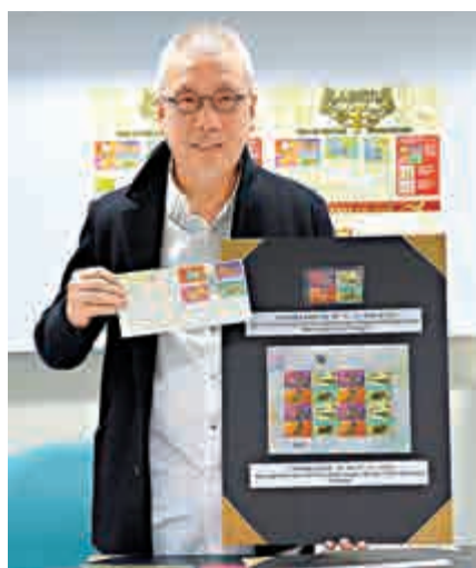
▲本月24日將發行新球強設計的羊年郵票。

金管局呼籲市民繼續支持使用「迎新鈔」代替新鈔封利是，支持環保。金管局從2006年開始提倡使用「迎新鈔」封利是，臨近農曆新年推出的「迎新鈔」，佔總出鈔量的比例由2006年的20%增加到近年約45%。