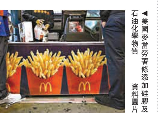
▲美國麥當勞薯條添加硅膠及石油化學物質 資料圖片

麥當勞長期被外界質疑在食物內添加多種化學物質，因此麥當勞為消除流言，在網上公開各種食物製造過程，而這次找來曾任美國電視節目《流言終結者》主持人之一的Grant Imahara，走入愛達荷州的薯條工廠，並在影片中公開麥當勞薯條的生產過程。