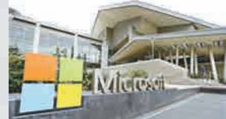
▲微軟21日發布最新作業系統Windows 10 資料圖片

更新至Windows 10後，使用者將可無縫切換觸控、滑鼠和鍵盤功能。新亮相的Continuum功能讓搭載Windows 10的裝置能像微軟Surface平板電腦和聯想Yoga超薄筆記本電腦一樣，同時支持觸控、滑鼠和鍵盤功能。