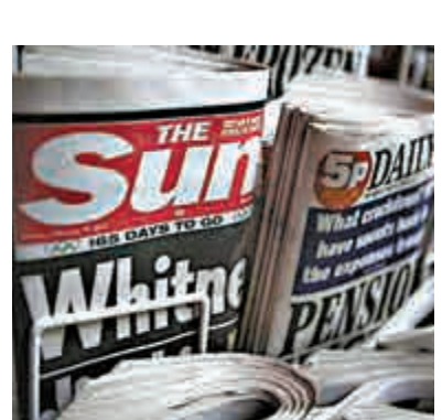
▲英國《太陽報》第三版22日再刊無上裝女模照片

【大公報訊】據英國廣播公司22日消息：英國《太陽報》第三版22日再刊無上裝女模照片，反駁多家媒體先前報道說，這項從1970年以來的爭議傳統將走入歷史。