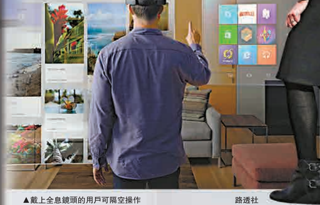
▲戴上全息鏡頭的用戶可隔空操作

全息鏡研究團隊的隊長奇普曼還廣發英雄帖，包括臉譜旗下的虛擬實境科技公司Oculus等創新業者齊聚一堂，「Oculus、Magic Leap、谷歌眼鏡開發商和其他人，我們誠摯邀請您，和我們一起創新全像圖技術。」奇普曼還指出：「全息影像有望成為人們日常生活的一環。」