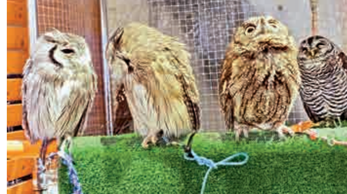
▲「貓頭鷹商舖」內的貓頭鷹種類繁多

儘管店內的貓頭鷹都很溫馴，到底不能像貓狗一樣訓練大小便，店員說，如果不小心「中獎」，還請顧客見諒。因此店員上飲料時會貼心附上杯蓋。