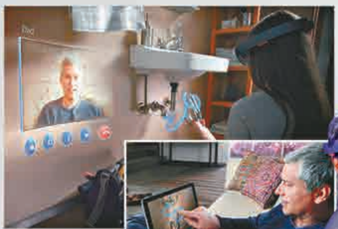
▲全息鏡頭讓溝通更直接