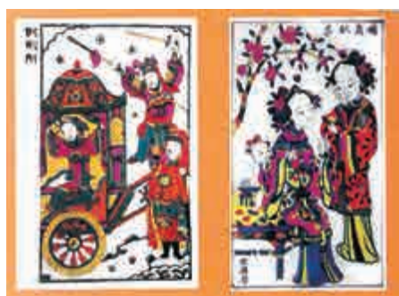
鳳翔舊版戲韻年畫

三十多年前，住陝西鳳翔，於城東十里的小里邨，得見幾位收藏家所展示一些珍稀舊版戲韻年畫，大開眼界。鳳翔乃我國西北著名年畫產區；清初有不少坊雕版印畫，以世興書店邵家字號（已結業）較老，清代舊版戲韻年畫，所印戲韻年畫，皆屬墨線版，工藝精細，多細線，線條較硬。筆者最喜歡其刻法十分古樸，和陝西漢中之版樣一樣古，風格保存原貌；而且留下古代地方戲曲版畫韻味；不少內容為戰國、兩漢、三國、魏晉及唐代人物。人物動作乃舞台身段，例如《逍遙津》（即曹操《白逼宮》）、《無底洞》（《西遊記》之「空山」）、《李逵奪魚》（《水滸傳》）等墨線版，皆使人過目難忘。附圖為鳳翔清版二款套色年畫。右方《瑞桃獻壽》，好比著名《雙美圖》（小三才）一樣出色。左方《回荊州》，雖略粗拙，但劉備與趙雲造型刻法獨特。