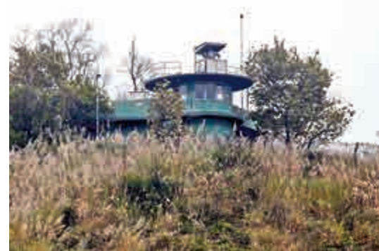
落馬洲山丘上的麥景陶碉堡

二〇一三年，當局縮減落馬洲邊境管制站至梧桐河段的邊境禁區範圍，有六條鄉村被劃出禁區以外，包括得月樓、料學、信義新村、馬草壟村、落馬洲村及下灣村。其中一座麥景陶碉堡位於信義新村對上山丘，村路旁有分叉路通連。雖然有鐵絲網包圍，不得進入，但可近觀其建築特色，是唯一無須禁區紙又容易到達的麥景陶碉堡。只是遊人普遍不知道有這樣的建築物，故在山下走過也不為意。