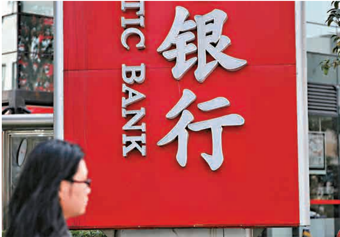
▲中國銀監會披露數據顯示，截至2014年12月末，中國商業銀行不良貸款率達1.29%，相較於三季度末的1.16%繼續攀升，亦創四年新高

「監管當局最高目標是防範金融危機的發生。」王兆星表示，央行和銀監會對金融系統做了壓力測試，按照國際標準，目前中國銀行資本充足水平已經接近13%，遠超國際所設定的要求，風險撥備