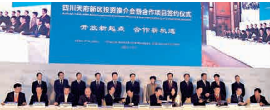
▲四川天府新區投資推介會暨合作項目簽約儀式共簽約988億元

中國僑聯副主席、香港世茂集團董事局主席許榮茂表示，四川是中國西部經濟發展最為發達的龍頭省份，世茂一直在尋求西部發展的優勢投資機會，到目前為止在成都、資陽等地已有多個投資項目，總投資額超過100億。