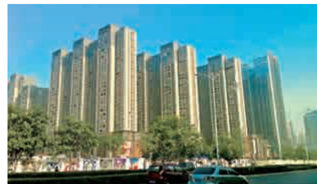
▲據悉，河南省政府此次公布的PPP項目涵蓋基礎設施建設各個領域、內容豐富