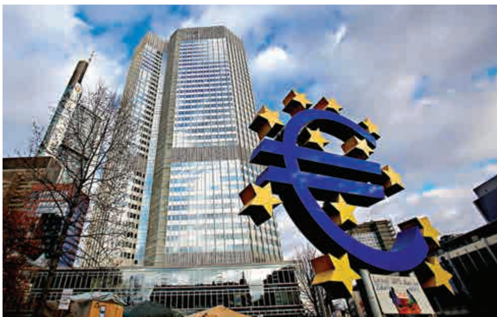
歐央行一如所料推行美式量寬，估計市場大量閒資會湧向亞洲等新興市場，港股也會受惠