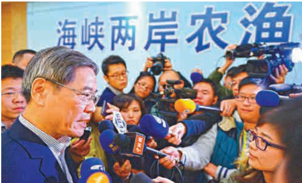
國台辦主任張志軍將於2月7日至8日赴金門參訪，並與陸委會主委王郁琦會面。

對於有記者問：大陸今年將舉行抗戰勝利70周年紀念活動，會否邀請國民黨軍隊的抗戰老兵、民間人士和國民黨主席朱立倫參加？馬曉光回答說，今年是中國人民抗日戰爭暨世界反法西斯戰爭勝利70周年，大陸方面將舉行盛大的紀念和慶祝活動。至於紀念和慶祝活動的具體時間、方式，包括邀請人員範圍，目前尚沒有具體消息發布。