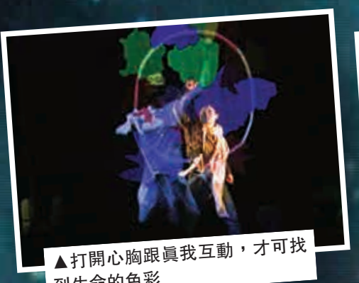
▲打開心胸認真我互動，才可找到生命的色彩