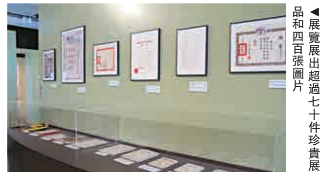
◀展覽展出超過七十件珍貴展品和四百張圖片