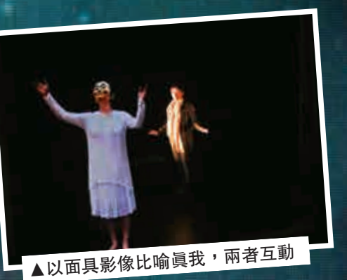
▲以面具影像比喻真我，兩者互動