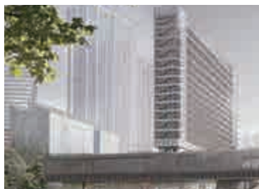
▲設計師筆下、呈倒轉「T」字形的M+博物館