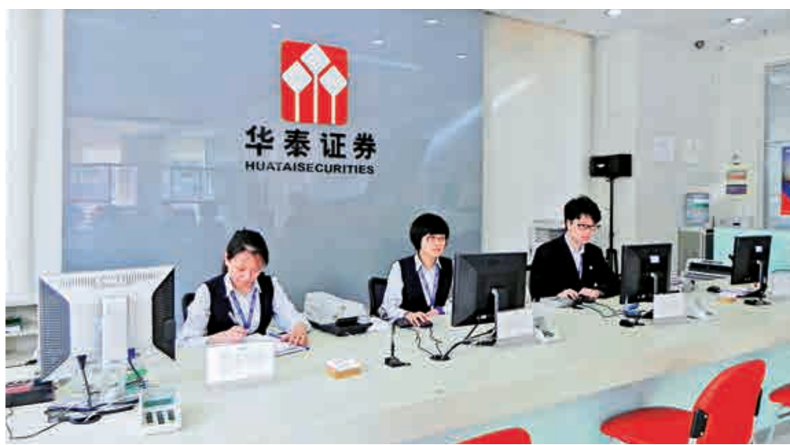
傳券商主動去槓桿，南北車A股遭華泰證券調出兩融標的池

自去年12月31日南北車復牌後，兩家公司連續拉出六個漲停。不過，公司重組利好所引發的資金炒作