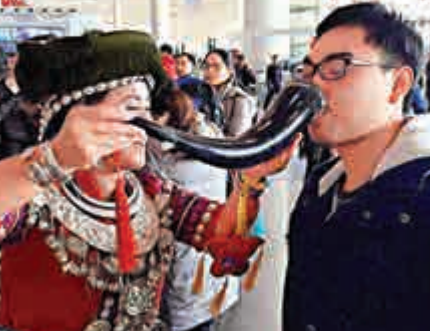
▲黔西南少數民族姑娘在機場為乘客敬上美酒

【大公報記者勞莉貴陽四日電】近日，來自黔西南的一群民族姑娘和小伙子們在行色匆匆的上海虹橋機場和北京首都國際機場點燃熱情，表演民族特色「快閃」秀，向旅客們獻上黔西南的民族歌舞《阿妹戚托》和《敬酒歌》，用這一獨特的方式進行航線推介和旅遊宣傳，向全世界發出邀請。