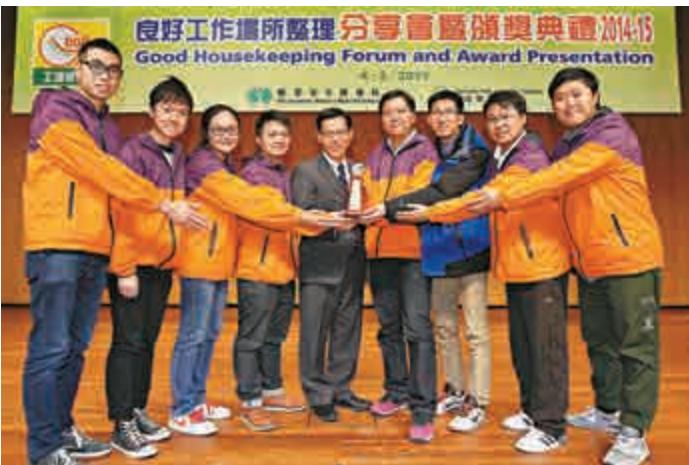
▲協興工程有限公司獲良好工作場金獎（建築業）

【大公報訊】記者呂少群報道：香港學術及職業資歷評審局總幹事李經文，獲委任為香港大學專業進修學院院長。這是繼前學術評審局主席梁智仁後，又一位學術評審機構高層為大專院校招攬。