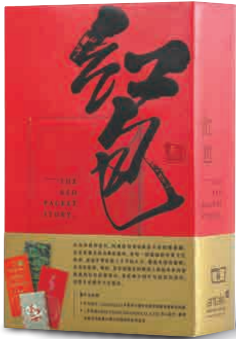
《紅包》由商務印書館二〇一四年十月出版