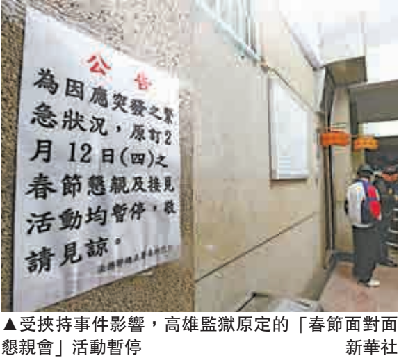
▲受挾持事件影響，高雄監獄原定的「春節面對面慰親會」活動暫停

毛治國表示，要嚴肅面對收容人管理安全議題，事件凸顯監所戒護管理有許多必須立即改善的重大缺失，「法務部」應督促矯正署在最短時間內公布調查報告，並徹底檢討原因，盡速提出改進措施，包括強化戒護風險管理、危機處理與平時教育訓練、收容人申訴管道等，防患未然，不能讓事件再度發生。