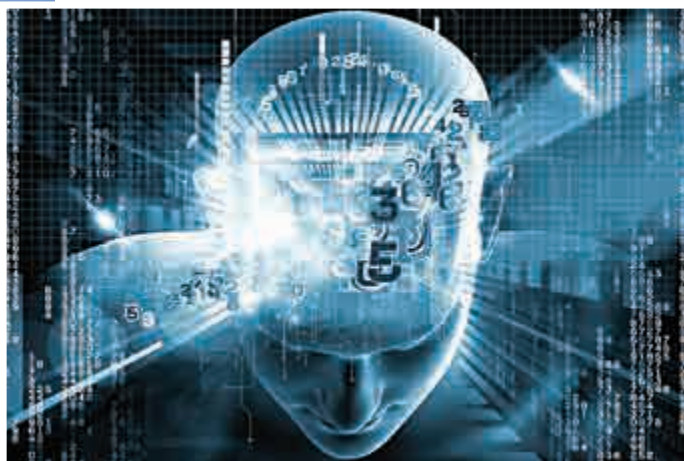
▲人工智能若發展成熟至能自我思考的程度，將來或會超越人類