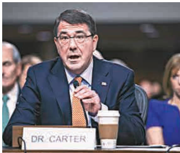
▲美國參議院12日正式通過了卡特的國防部長提名

美國報章認為，卡特的任命能在共和黨主導之下的參議院輕易過關，就是因為參議員認為卡特能夠擋下來自白宮的壓力，而民主黨的參議員則認為他是一個資歷完整的專業官僚，而非政客。五角大樓上月曾表示，卡特已經着手與哈格爾進行工作交接。目前，卡特宣誓就職的日期尚未公布。