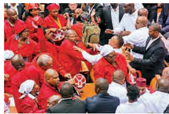
▲南非自由鬥士黨的議員（紅衣者）與安保人員在國會打成一團

【大公報訊】據路透社12日消息：南非總統祖馬12日到國會發表年度國情報告，卻爆發全武行。