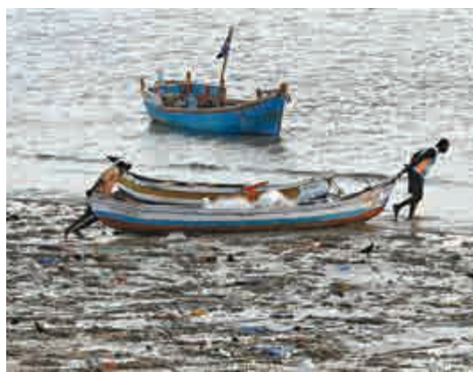
▲印度孟買的漁民將一艘裝滿垃圾的船隻推出海

因此，科學家們建議，最佳避免海洋方法就是改善沿岸的廢物管理系統，以及勸導世界大眾停止扔垃圾。