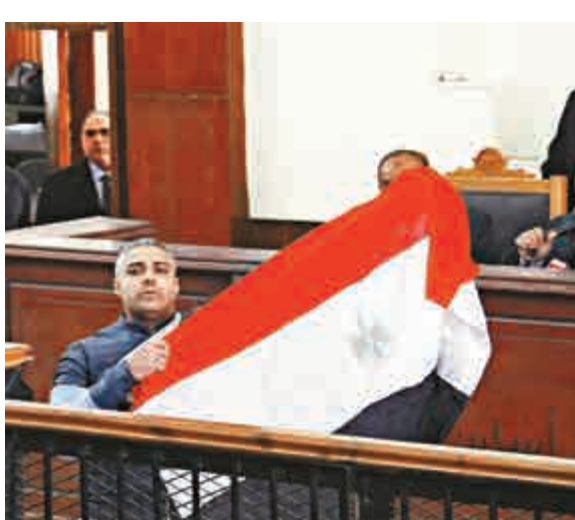
▲擁有加拿大和埃及雙重國籍的半島電視台記者法赫米12日在開羅法庭展示埃及國旗

但是近月來，卡塔爾驅逐了多名穆斯林兄弟會的高層領導人，也暫停了半島電視台在埃及分支的廣播。但也有分析認為，埃及法院批准兩名記者保釋，意味有可能裁定兩人無罪。