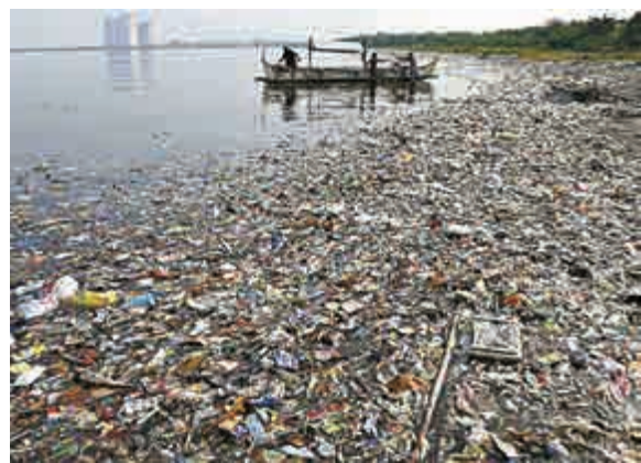
▲菲律賓馬尼拉灣沿岸漂滿各種垃圾

科學家認為，發展中國家之所以是海洋塑膠垃圾的最大製造者，因為他們缺乏配合經濟高速增長的垃圾處理體系。若能減少50%的不當廢棄物處理，就能在2025年底前將流出量減少40%。拉文德·勞說：「投資於廢物管理基建，在經濟迅速發展的國家尤其如此。在發達國家，我們也有責任減少廢物數量。」