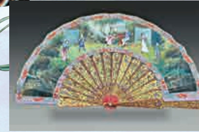
▲髹紅漆彩繪西洋人物摺扇