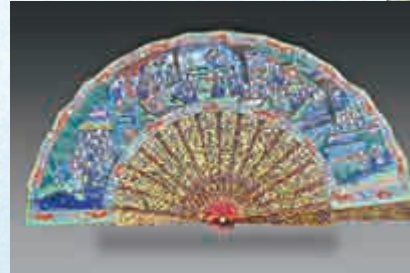
▲髹紅漆彩繪西洋人物摺扇（反面）