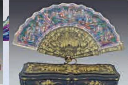
▲彩繪群仙祝壽紋摺扇（帶扇盒）