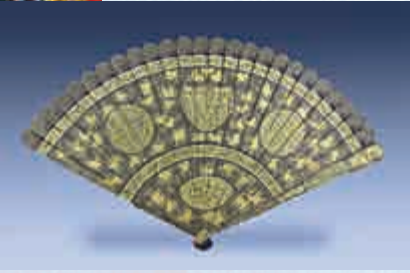
▲黑漆描金葡萄紋摺扇