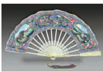
▲象牙骨彩繪人物伸縮摺扇（反面）