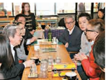
曾俊華說，希望大家不要隨便輕言創業

曾俊華強調，「小型貸款計劃」不是慈善工作，必須自負盈虧，所以計劃對借款人的營商方案審批比較嚴格，沒有提供免息或低息貸款，反而提供營商導師從旁協助獲批的借款人。