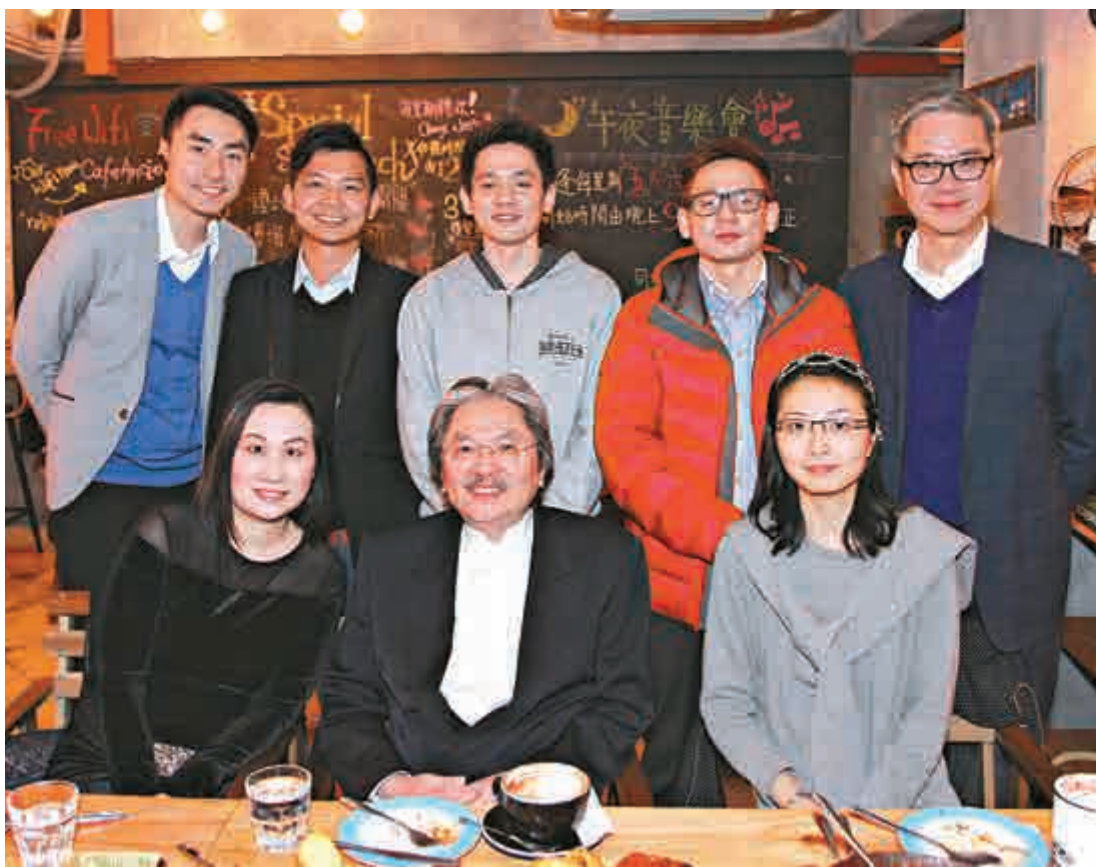
曾俊華與計劃下的借貸人交流