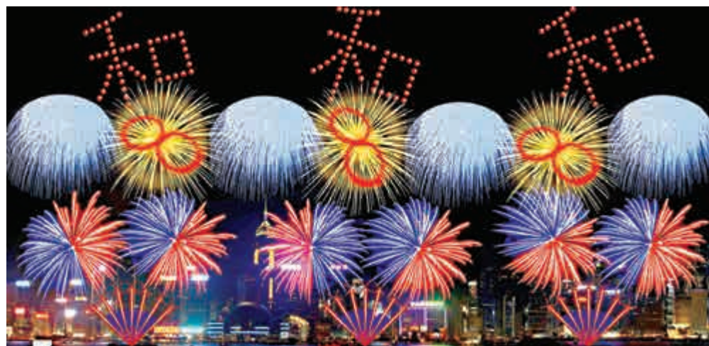
▲農曆新年煙花匯演將於大年初二晚上舉行。九幕表演歷時23分鐘，當中第七幕《家是香港》，上空除了展現象徵幸運的「8」字外，也有代表和平、祥和的「和」字