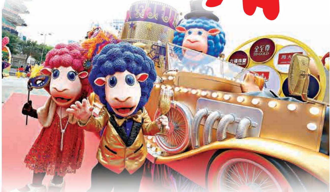
▲盛大新春花車巡遊將於大年初一舉行

入境處預計，今年農曆新年假期期間（即昨日至25日）約有788萬旅客人次經海、陸、空管制站進出香港，較去年同期增加約7.7%。當中約72.4%的旅客，即570萬人次，會經各陸路邊境管制站進出香港。為疏導旅客流量，入境處已從內部抽調人員支援各管制站的工作，並已減少前線人員休假，以彈性調配人手，加開檢查櫃檯及通道以疏導人潮及車流。同時，入境處亦會增派保安人員協助維持旅客過關秩序。