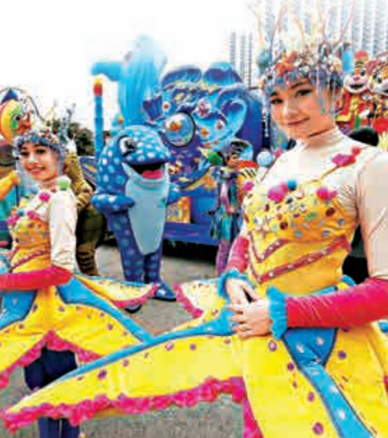
▲各支巡遊隊伍為演出做最後準備

曹先生：最想身體健康、社會和諧。現在樓價高企，希望下年樓市下調至合理水平，個個人都可以安居樂業