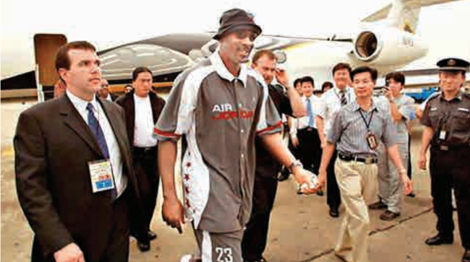
▲這是米高佐敦（前排左二）二〇〇四年乘坐私人飛機訪問中國的資料圖片

今年NBA中國賽的兩個主辦城市有調整，上海依然是其中之一，深圳則第一次承辦NBA中國賽。