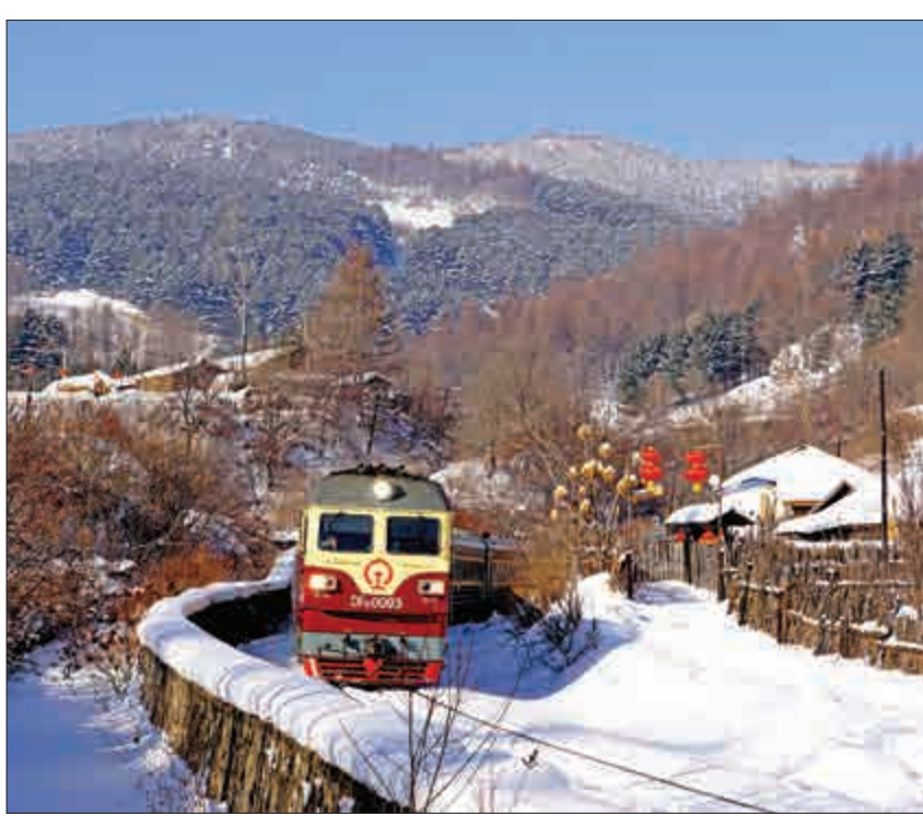
小火車進山

到了除夕夜，村裡，院子裡，到處是晃動的燈籠，打着燈籠到街上來了，大街上，胡胡裡，到處是晃動的燈籠，孩子們追逐着，看看誰的燈籠最亮，誰的燈籠最漂亮。大年初一是男人的世界。凌晨兩三點鐘，成串的鞭炮聲在各個家庭的院子裡響起來了，這是吃水餃前必須的項目。然後，家裡那群老幼輩就會率領着子孫走出家門，去村裡的長壽亭拜年。我們村那些年輕男子長大，這個過程總是會持續兩三個月的光景。我們村這些年輕輩高才走出來的學生就有一百多人，大家分布在全國各地，過年的時候基本都會回來，我們這些人自然成為村裡的風采。到了每個家庭，給長輩拜年以後，說說自己所在城市的事情，談談自己的工作，那種股股的親切，溢滿情懷。