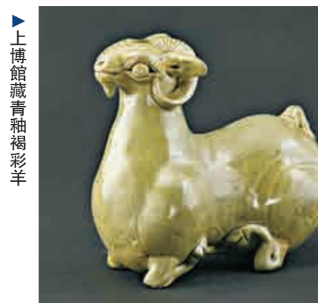
▲上博館藏青釉褐彩羊