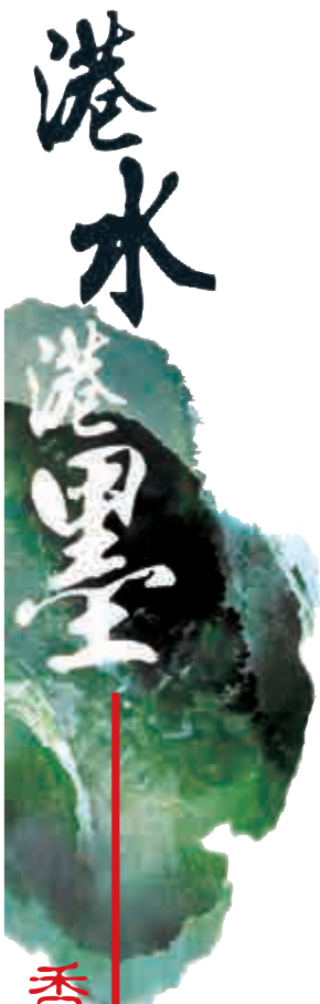
香港當代水墨畫家作品介紹