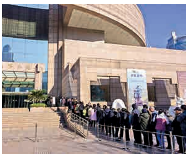
▲大年初一大早，上海博物館門口就排起長隊