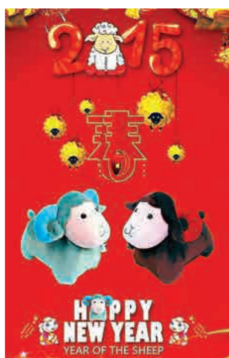
▲為了迎接羊年，上博推出海報中的青釉褐彩羊創意變形頸枕