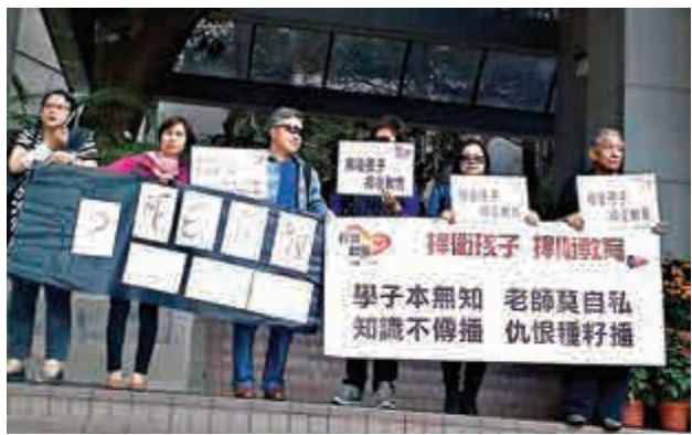
▲一群家長昨日到港大請願，希望校董會慎選副校長人選

另一方面，公開大學校長黃玉山認為今年財政預算令人滿意，美中不足是未能善用豐厚盈餘增加教育撥款，「例如配對基金可以考慮再推，對我們這些非資助大學來說，借助配對基金以增加籌款金額很有需要。」他又說，上月公布的院校研究報告（RAE 2014）顯示多間院校的研究優勢，財政司長其實應考慮撥款鼓勵深化有關研究，發揮院校所長以裨益香港。