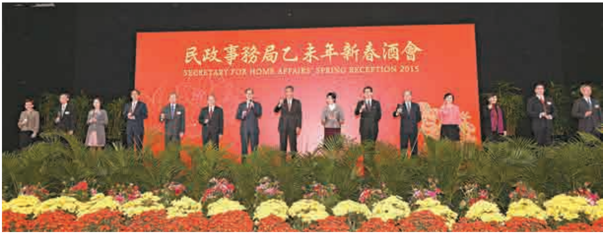
▲行政長官梁振英（中）與政務司司長林鄭月娥（右七）昨出席由民政事務局局长曾德成（左七）主持的新春酒會

【大公報訊】記者吳卓峰報道：新年新氣象，民政事務局昨日舉行乙未年新春酒會，政府一衆高官與地區賢達共慶新春。民政事務局局長曾德成致辭時呼籲，香港人要自強，通過充實自己、做好本分和發展事業，推動社會穩紮穩打地進步，特別是推動政制發展，打開新局面。他希望各界新的一年團結一心，以香港整體利益爲先，求大同存大異，超越對立，攜手把香港發展帶上新台阶。