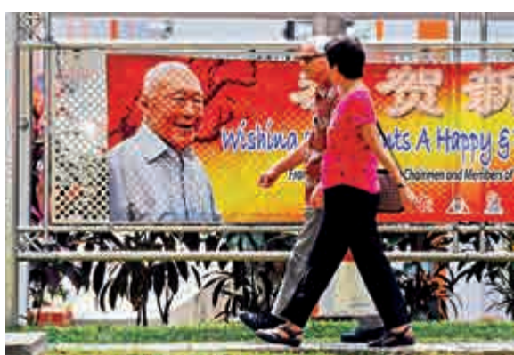
▲2月26日，印有李光耀頭像的橫幅掛在新加坡丹戎巴葛集選區