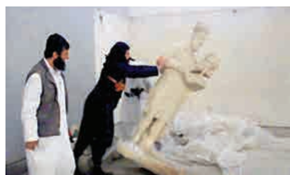
▲ISIS武裝分子推翻伊拉克摩蘇爾尼尼微博物館的一座雕像

【大公報駐倫敦記者李威26日電】英國政府26日公布，該國淨移民數字繼續增長至近30萬人，遠高於首相卡梅倫執政前的水準，且幾乎三倍於他承諾的任內削減移民數量的目標。分析指，卡梅倫無法兌現承諾將令其非常尷尬，隨着英國大選的臨近，移民問題將給他的選情帶來政治壓力。