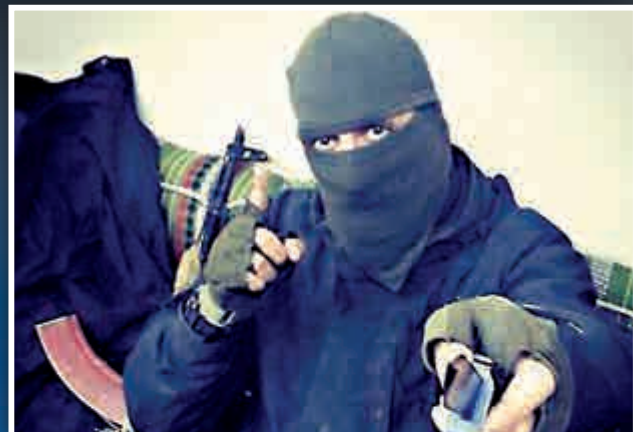
▲英美當局相信「聖戰約翰」原名是因瓦澤