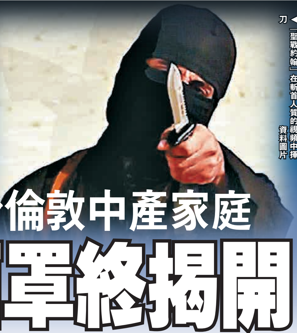
刀「聖戰約翰」在新首人質的視頻中揮