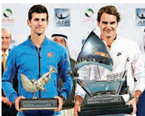
▲費達拿(右)與祖高域在領獎後合照

收穫本季第2個男單錦標的費達拿，賽後將與祖高域的對賽戰績改寫為20勝17負，他高興地說：「7次奪冠的感覺極棒了，我與祖高域打了一場表現極佳的比賽，他(祖高域)的確是一位很強的對手。」費達拿今仗開出12次「Ace」，成為史上第4位於職業生涯打出「9000+」「Ace」的職業球手。