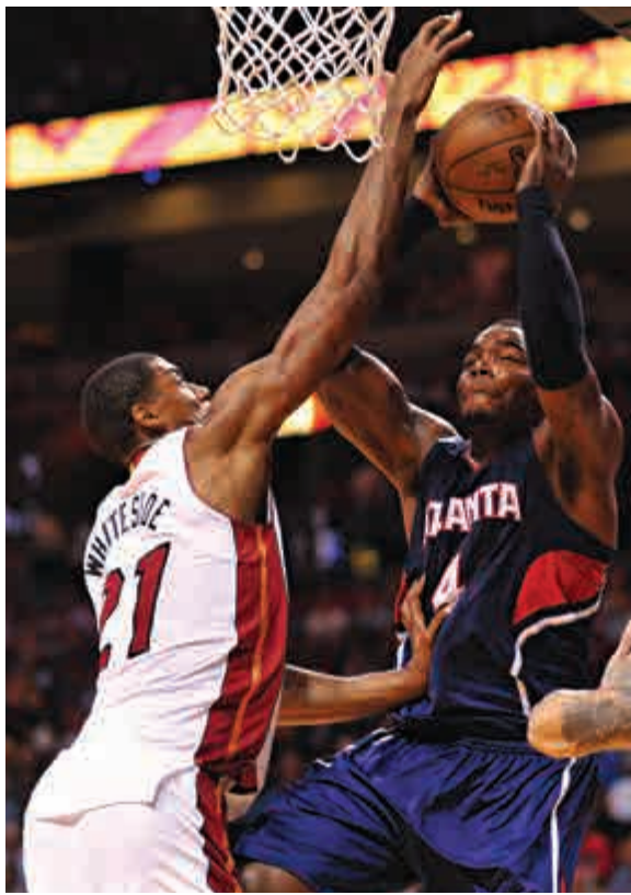
▲雄鷹前鋒米薩(右)無懼熱火球員H韋西迪的攔截，奮力上籃

同日，太陽場出戰馬刺一役，前者全場命中率僅得可憐的18.6%，最終以74:101慘敗收場。太陽上半場僅收穫24分，同時打破球隊於2011年迎戰帝王時創下的25分隊史半場最低得分紀錄。