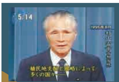
村山談話是時任日本首相村山富市（上圖）在1995年8月15日，第二次世界大戰日本宣布無條件投降50周年紀念日發表的談話。村山談話承認日本過去實行了錯誤的國策，走了戰爭道路，並表示，要深刻反省歷史，吸取歷史教訓，不再重犯過去的錯誤。該談話受到中華人民共和國、韓國等曾遭受日本殖民主義禍害的國家及日本國內部分人士的肯定。

他呼籲日方以實際行動維護和落實中日四點原則共識，妥善處理兩國之間的複雜敏感問題，這樣中日關係才有轉圜的可能。如果日本對四點原則共識置之不理，還製造新的麻煩和障礙，中日關係將會更加困難。