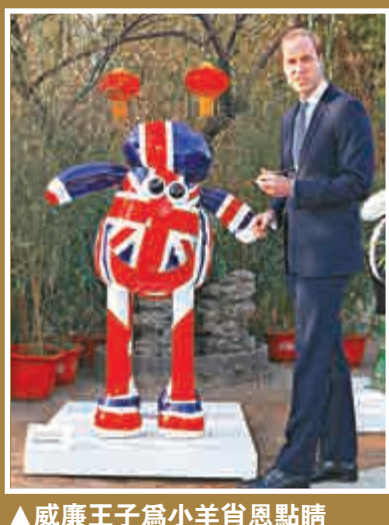
▲威廉王子為小羊肖恩點睛