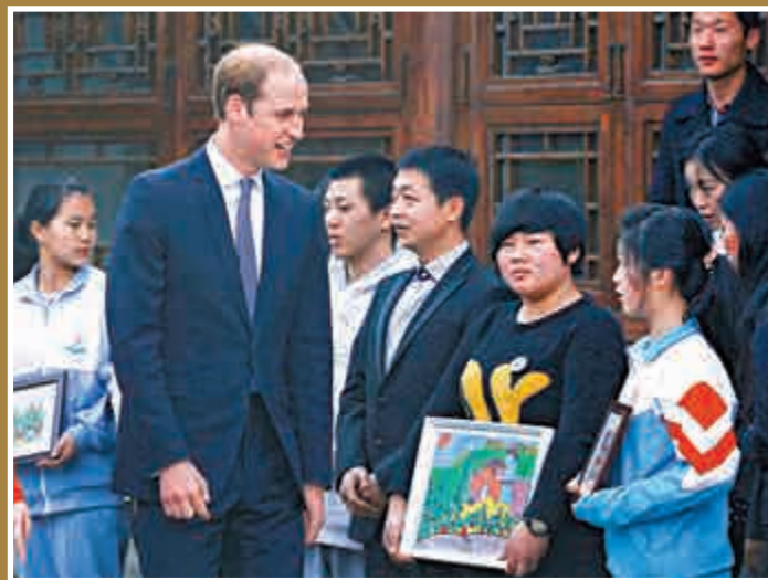
▲威廉王子在北京石家胡同與青少年交談

另據了解，3日，威廉王子將前往南洋中學參觀該校學生的足球活動，並與在滬英商會面，晚間還將出席英國著名動畫電影《帕丁頓熊》首映。