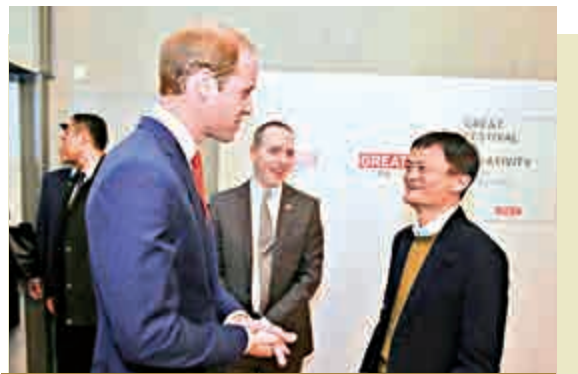
威廉晤馬雲：盼天貓多推英國貨

2日，威廉王子和馬雲在上海會面，希望通過天貓帶給中國消費者更多的英國品牌。截至目前，無論是皇室御用，還是國民最愛，已經超過130家的英國品牌來天貓開店。（今日早報）