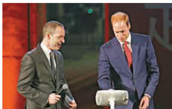
▲3月2日，英國威廉王子在上海出席「創意英倫」盛典開幕式