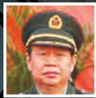
黃獻軍 山西省軍區政治 部原主任