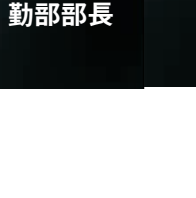
蘭偉傑 湖北省軍區原副 司令員