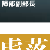
陳紅岩 北京軍區空軍政 治部副主任