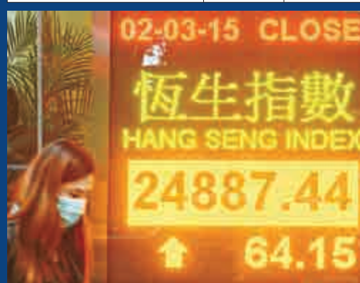
▲恒指昨日高開173點，觸及24996點便已屬於全日高位，指數早段更會倒跌107點