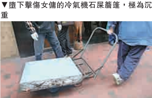
▼墮下擊傷女傭的冷氣機石屎簷篷，極為沉重

警方、屋宇署等部門人員，及後返回現場調查、核對建築圖則及拍照存案。有工人搬走大批證物，包括血漬斑斑床褥及石屎簷篷。