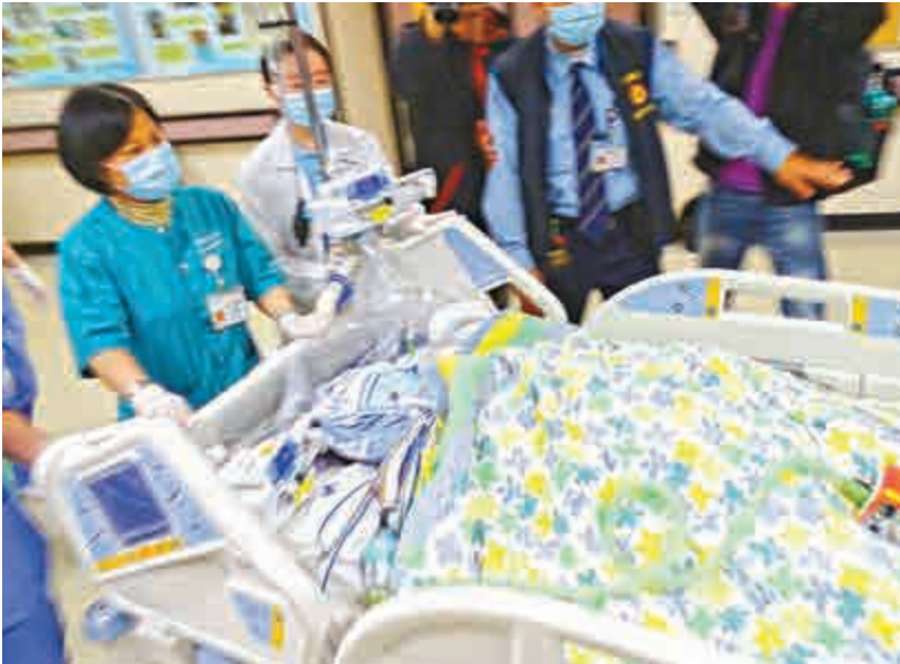
▲慘遭冷氣機石屎簷篷擊中女傭，送院搶救後命危

陳指女事主與同鄉感情要好，將床褥搬到帳篷底，與同鄉談天，免擾他人休息，怎料禍從天降。陳指現場無僭建物，去年接獲當局信件，已拆除疑似僭建物，如當局認為帆布帳篷屬僭建，將配合拆除。