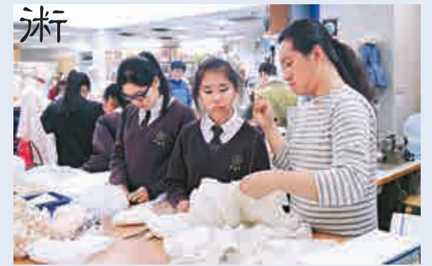
▲導師示範劇裝製作