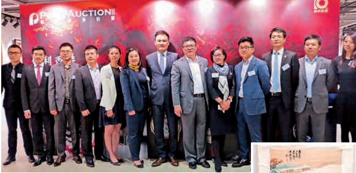
▲保利各部門專家出席預展並介紹春拍重點拍品