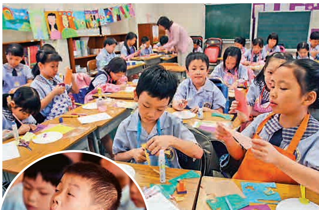
▲教育局要求全日制學校上學日數不應少於190日，而這上學日數是包括測考、水陸運會、旅行、試後活動及典禮的日子等

另外有個說法，家長其實不喜歡學校放這麼多假。因為在上課的日子，子女還可以認真地學習，一到放較長的假期，家長照顧不了，學生的學習能力和心態都變差了，何苦要放這麼多假呢？