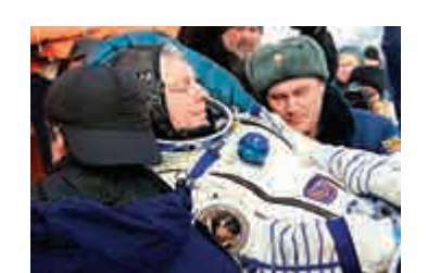
▲俄太空人薩摩庫耶夫

在太空站167天駐站期間，3人接收了多艘貨運飛船，進行了多次太空行走並完成了幾項科學實驗。目前，太空站上還有3名太空人值守，新一批駐站太空人預計於本月27日乘坐聯盟飛船飛往。