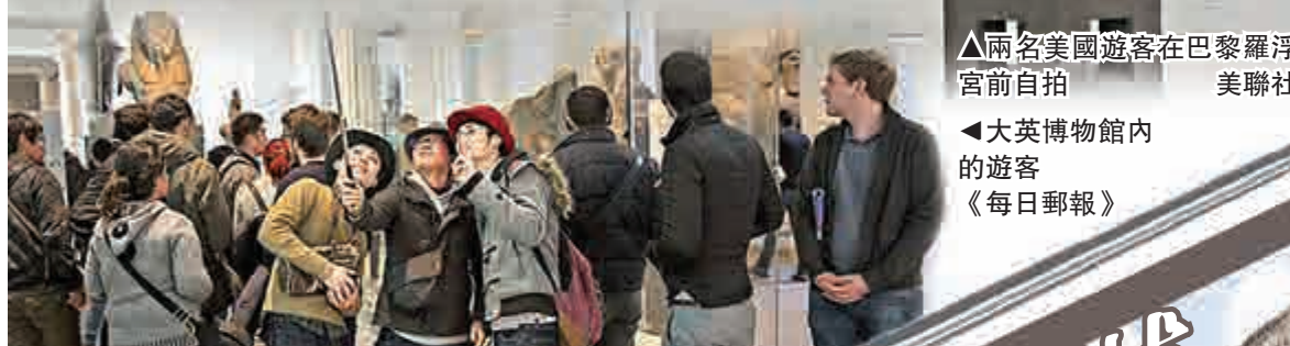
▲兩名美國遊客在巴黎羅浮宮前自拍

臨近倫敦國家美術館的倫敦國家肖像館表示，允許「自拍神棍」入內，但「任何有可能被證明具有破壞性的東西將持續接受審查」。正在參