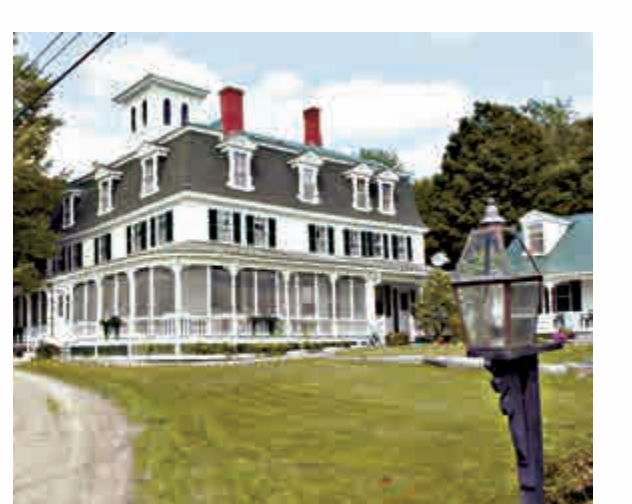
▲緬因州西部的中洛威爾旅館

參賽者必須在5月21日前交出作文，題目是：「我為什麼想擁有和經營鄉村旅館」，寫得最棒的參賽者就能贏得這間備受夏日度假客喜愛、位於緬因州白山山脈的旅館。