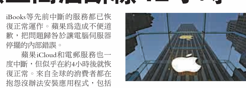
▲蘋果iTunes和App商店無法正常登陸12小時 資料圖片

蘋果iCloud和電郵服務也一度中斷，但似乎在約4小時後就恢復正常。來自全球的消費者都在抱怨沒法安裝應用程式，包括荷蘭、冰島，Reddit論壇則有英國、澳洲等地用戶回報問題。