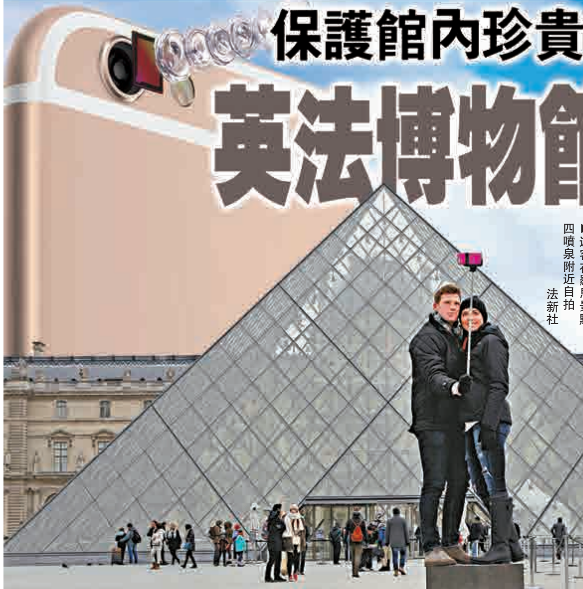
四噴泉附近自拍