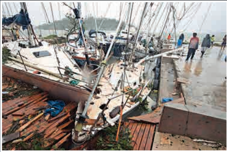
▲「帕姆」摧毀停靠在維拉港的船隻