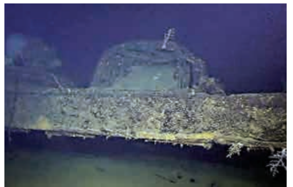
▲沉在海底的日本二戰時期大型主力艦「武藏號」

「武藏號」是日本當年大和級主力艦的第二艦。武藏是日本古國名，即日本東海道的武藏國。「武藏號」1942年服役，1944年10月進入菲律賓西布顏海，遭到美軍航空母艦機隊攻擊。經過3輪空襲，「武藏號」傾斜脫離編隊，最終傾覆沉沒。