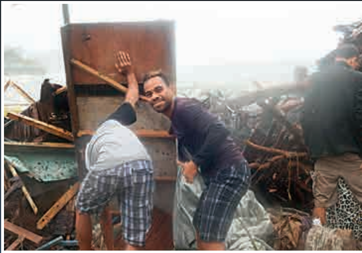
▲風暴平息後，災民14日上街收拾殘局