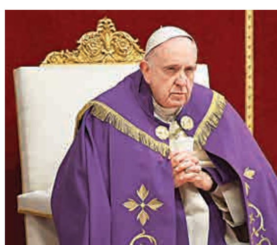
▲教皇方濟各13日表示自己任期不會長久

天主教於西元1300年首次舉辦聖年活動。近代每25年舉行一次，最後一次聖年是在2000年由教皇若望保祿二世主持。原本預計在2025年才再度開啓的聖伯多祿大教堂聖門，將在今年12月提前開啓大門，因為方濟各安排了特殊聖年。