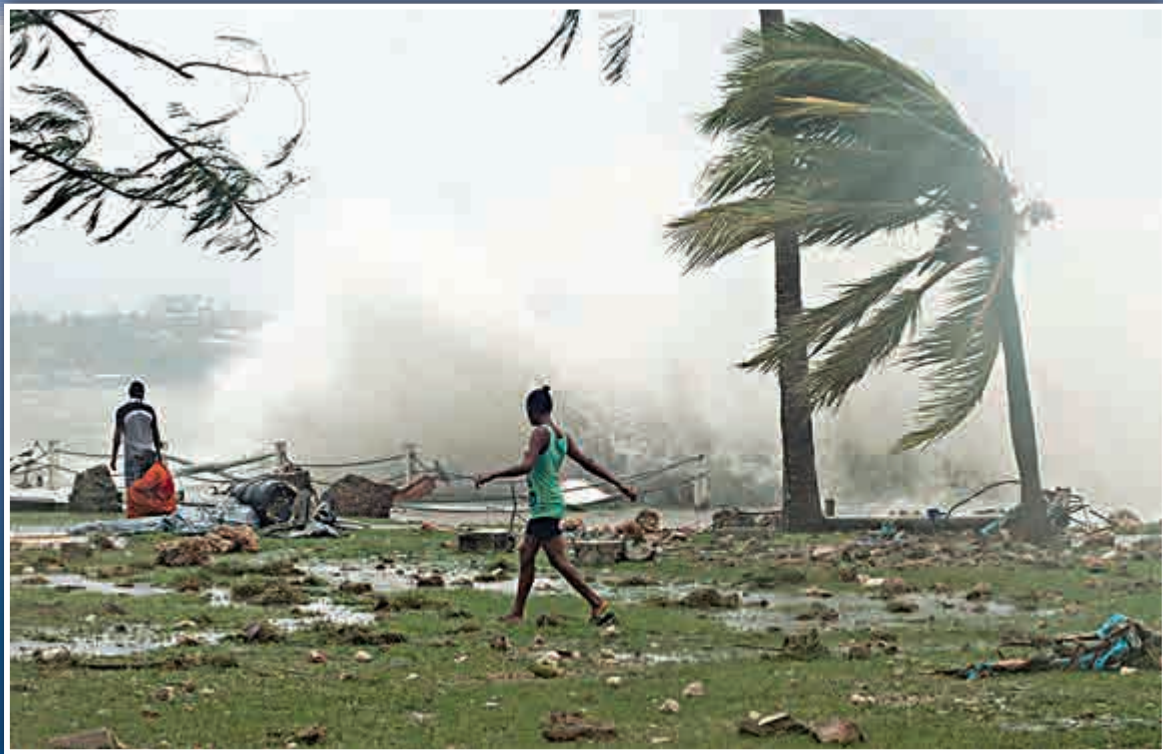
▲「帕姆」14日襲擊瓦努阿圖，掀起巨浪

「帕姆」在肆虐瓦努阿圖前，橫掃過了所羅門群島和圖瓦盧。鄰近的巴布亞新幾內亞救援人員表示，風暴在當地至少奪走一條人命。新西蘭當局則正備戰預料周日及周一將經過該國北部的風暴。