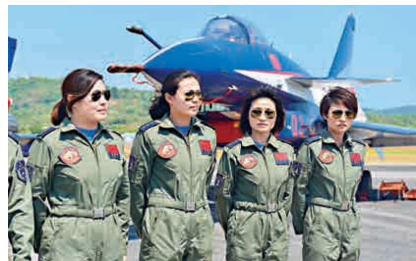
▲3月17日，中國空軍八一飛行表演隊在馬來西亞蘭卡威舉行的第13屆蘭卡威國際海空展上進行飛行表演