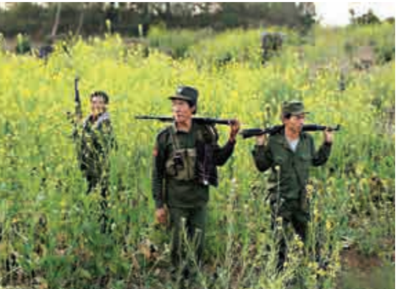
▲緬甸政府3月開始在中緬邊境和緬甸民族民主同盟軍作戰。圖為果敢士兵在備戰巡邏

不過，果敢同盟軍高層並不覺得這是好事：「他們會立即派出新的師長，而且會更加賣命地發動攻擊。」