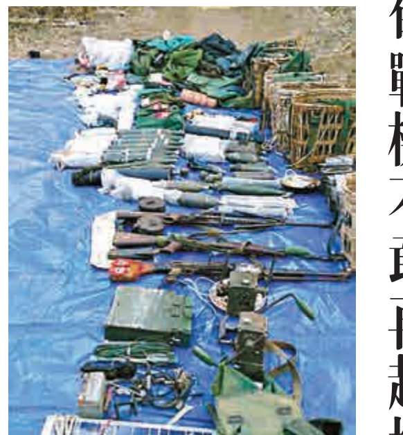
▲果敢武裝繳獲緬軍的部分武器及裝備