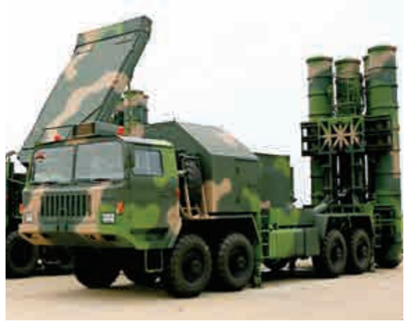
▲紅旗9導彈系統包括1輛指揮車，控制車、目標雷達照射車、搜索雷達車各6輛

更重要的是，紅旗9不僅在產品質量、作戰性能上與同類導彈難分高下，但售價卻是「白菜價」，報價至少比美國、歐洲的競爭對手報價低10億美元。可以說，紅旗9之所以能夠贏得土耳其的軍購合同，價廉物美是其中的一個最具誘惑力的因素。原來是西方國家壟斷銷售的市場，現在有了貨比三家的機會，土耳其堅持選擇物美價廉的紅旗9也就是情理之中了。