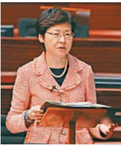
►政務司司長林鄭月娥昨日在立法會回答議員質詢時強調，希望議員尊重行政長官向中央負責的憲制責任

【大公報訊】記者馮瀚林報道：對於行政長官述職規範化的具體內容，政務司司長林鄭月娥昨日在立法會回答議員質詢時強調，希望議員尊重行政長官向中央負責的憲制責任，重申一般做法是不適宜公開特