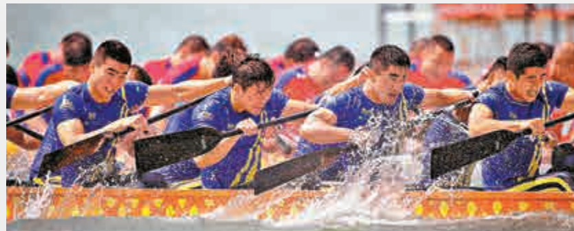
▲參賽龍舟隊在萬寧站比賽決賽中激戰

2015中華龍舟大賽決賽21日在海南萬寧上演，來自各地的32支隊伍爭相角逐，其中，平均年齡超過50歲的香港友誼隊首次參賽便斬獲職業女子組季軍。順德樂從傢俱隊以49分奪得職業男子組總冠軍。比賽現場近七萬觀眾在賽道兩旁圍觀，不斷為正在比賽的隊伍吶喊歡呼。 【大公報實習記者 陳茜茜】