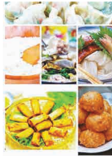
▲京老字號紛推時令美食

3月21日迎來立春節氣，也是農曆二月初二，中國民間俗稱「龍抬頭」的日子。北京多家老字號也抓緊這「雙節相逢」的商機，擺出時令民俗食品，種類豐富，以「龍」打頭，堪稱「全龍宴」。中國人講究「民以食為天」，按照老北京的食俗，春分要吃驢打滾、太陽糕。在「龍抬頭」這天的飲食則都要「沾龍氣兒」，有「龍鱗」春餅、「龍膽」炸糕、「龍耳」餃子、「龍鬚」陽春麵等。