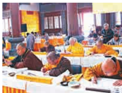
▲書法家們現場同抄經典

在中國，大約自二世紀後半開始，有人將譯出的佛典以文字書寫，並流傳民間；四至五世紀以後，書寫佛典之事亦逐漸風行，世人看重寫經功德而特意書寫某些經典。 【大公報記者 楚長城】