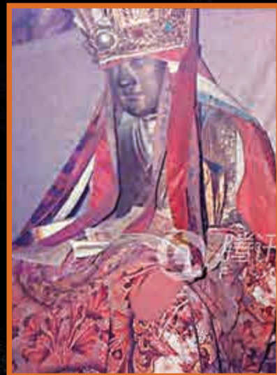
▲福建陽春村「肉身菩薩」被盜前的資料圖

匈牙利博物館近日展出一尊千年佛像，佛像內因藏有一名高僧的遺骸引起外界關注。而在千里之外中國福建的一個小山村，這尊佛像的展出喚起了村民塵封的記憶，因為這極有可能是福建三明市大田縣陽春村20年前被盜走的「肉身菩薩」。這一消息經媒體廣泛傳播後，該佛像的收藏者要求荷蘭方面於20日下午已從匈牙利博物館將其撤走。