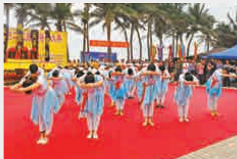
▲祭海大典六佻舞

上午9時，記者看到幡旗招展的祭海儀仗巡遊隊伴隨着鞭炮和鑼鼓聲，沿襲五源河畔千年傳承的「抬公巡遊」的方式，在海龍王、天后娘娘、水尾聖娘三大海神神像的帶領下從西海岸觀海台巡遊至假日海灘廣場祭壇，吸引了大批市民前來觀看、祈願。祭海是沿岸漁民在漫長的耕海牧漁生活中創造的一種獨特特色的漁家文化，表達了衣食於海洋的人民對大海的感恩與崇敬心情。 【大公報實習記者 梁蕾 記者 何春光】