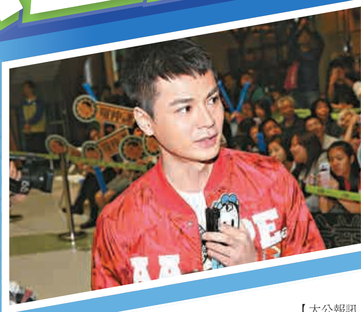
▲謙仔坦認忘記了元宵節及白色情人節