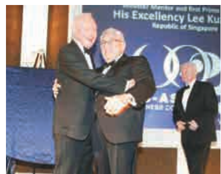
▲美國與東南亞國家聯盟商務理事會於2009年頒給李光耀終身成就獎，圖為李光耀與前美國國務卿基辛格（中）在頒獎禮現場擁抱

「也許這就是李光耀在他那個時代的角色。他對於我們的世界抱有同樣的希望。他為更好的世界而奮鬥，儘管現實證據是模糊的，但我們中的許多人聽到了他的聲音，永遠不會忘記他。」