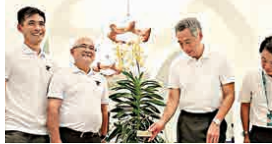
▲李顯龍（右二）接收以李光耀名字命名的蘭花 互聯網