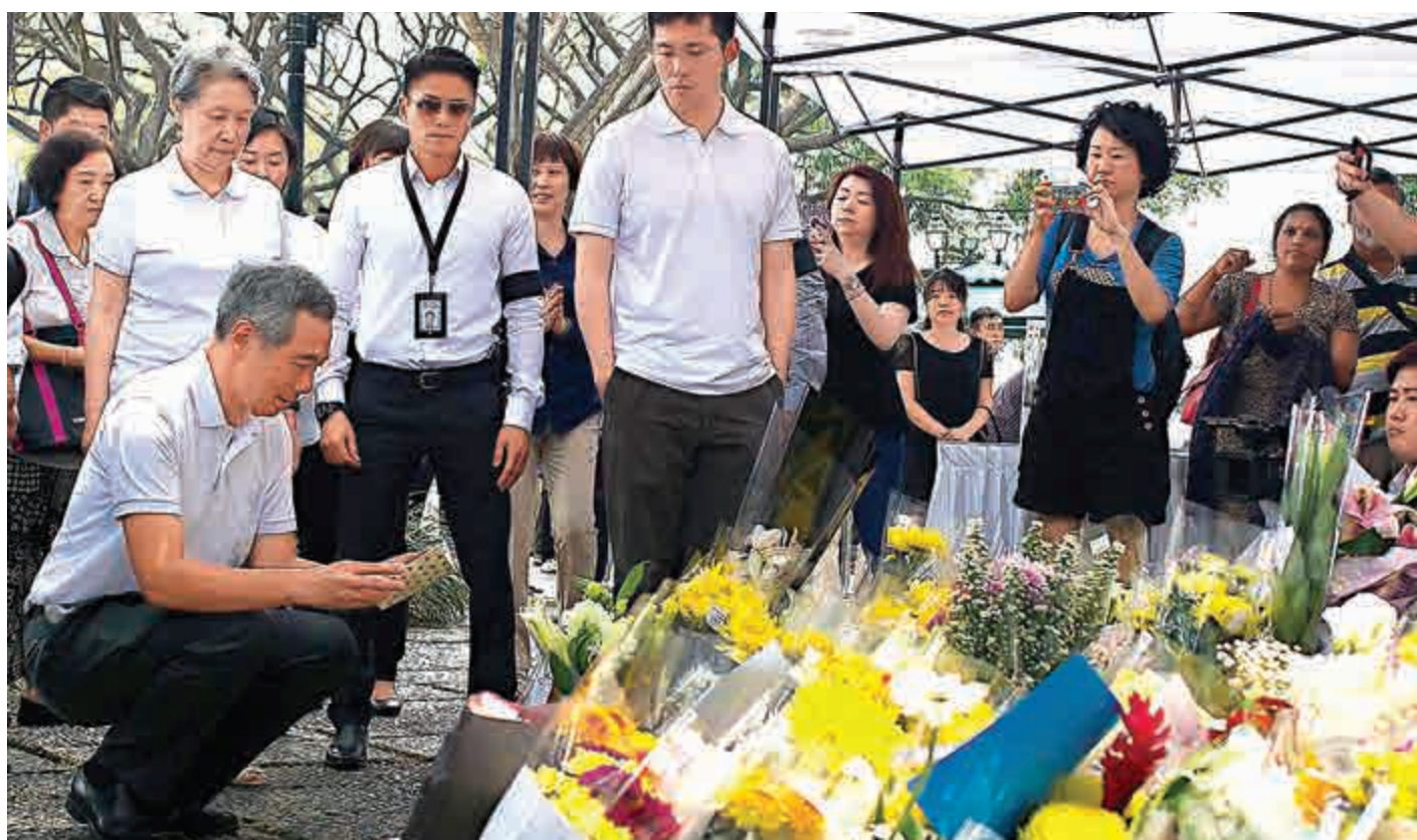
▲新加坡總理李顯龍（左一）24日在總統府外的公眾弔唁處閱讀民眾給父親李光耀的留言

從25日起，李光耀遺體將安放新加坡國會大樓供公眾瞻仰，國葬儀式將於29日在新加坡國立大學文化中心舉行。印度總理莫迪、韓國總統朴槿惠在內的國家領導人，預計將出席葬禮。美國總統奧巴馬23日晚致電李顯龍致哀，再次盛讚李光耀「卓越的領導力」。