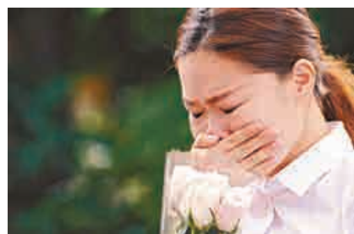
▲一名女子24日在新加坡總統府外悼念李光耀時流淚

【大公報訊】新加坡前總理李光耀前日凌晨病逝，新加坡駐港總領事館一連六日設弔唁冊供公眾悼念李光耀。昨日前往弔唁的人潮比首日更多，多名高官及政商界名人先後前往弔唁，包括外交部駐港公署特派員宋哲，政務司司長林鄭月娥、財政司司長曾俊華、行政會議召集人林煥光等。 位於金鐘夏慤道海富中心的新加坡駐港總領事館昨日人潮絡繹不絕，有人帶同鮮花悼念李光耀，也有不少人全家總動員向這位新加坡之父最後致敬。由於前往弔唁的人太多，領事館外一度出現人龍，輪候室更一度爆滿，部分人要站在室外等候。先後到場的還包括運輸及房屋局局長張炳良、發展局局長陳茂波、教育局局長吳克儉、行會成員羅范淑芬、陳智思，機管局主席羅康瑞及其太太朱玲玲、前財政司司長梁錦松、前行會召集人夏佳里、民建聯立法會議員譚耀宗、蔣麗芸，經民聯立法會議員梁美芬、港交所主席周松崗等。 昨日下午前往弔唁的港區全國人大代表蔡素玉表示，李光耀是華人之光，以前也會覺得新加坡管治得太嚴，但現在明白李光耀的做法有其道理，「偉大的人是不需要討好其他人，若他不是用這個方法，可能今日新加坡沒有這麼富強。」新加坡人單先生稱，李光耀思維獨特，雖接受西方教育，卻仍有華人傳統思想，「沒有李光耀，就沒有今日的新加坡。」