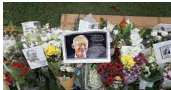
▲新加坡民眾在斯里淡馬錫總統府官邸外放置的悼念花束和卡片