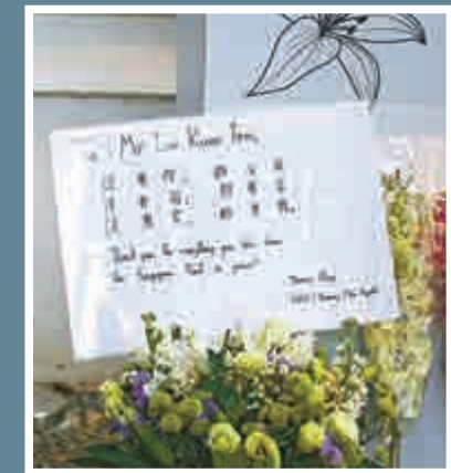
▲新加坡小朋友王樂心獻給李光耀的弔唁卡

李光耀的靈堂設在官邸前廳，布置簡單而高雅，棺木前擺了大型的李光耀肖像，棺木則主要用白色和柔雅顏色的蘭花裝點。靈堂內播放着古典樂，場面莊嚴肅穆。室內空間不大，每次只能讓十多人在靈堂前鞠躬。