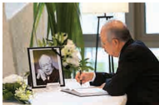
▲馬來西亞總理納吉布24日在吉隆坡的新加坡大使館內簽署弔唁卡