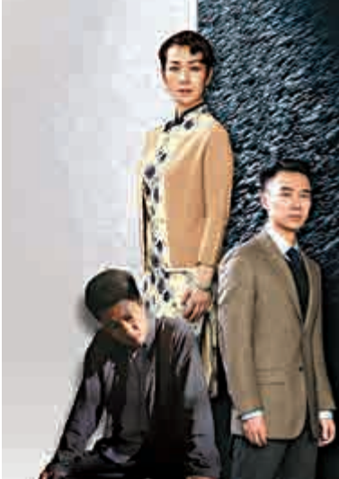
▲《小城之春》講述知識分子間的愛恨糾結