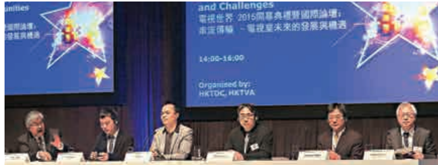
▼國際論壇以「串流傳輸——電視業未來的發展與機遇」為主題