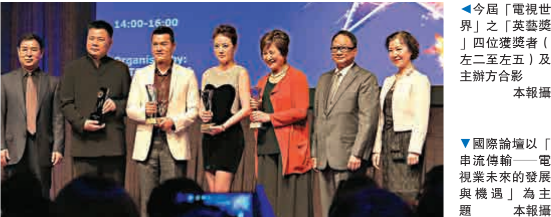
▲今屆「電視世界」之「英藝獎」四位獲獎者（左二至左五）及主辦方合影

是次國際論壇以「串流傳輸——電視業未來的發展與機遇」為主題，就串流傳輸電視的普及帶