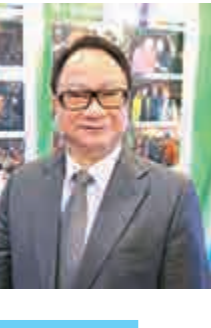
業能獲得到政府的重視