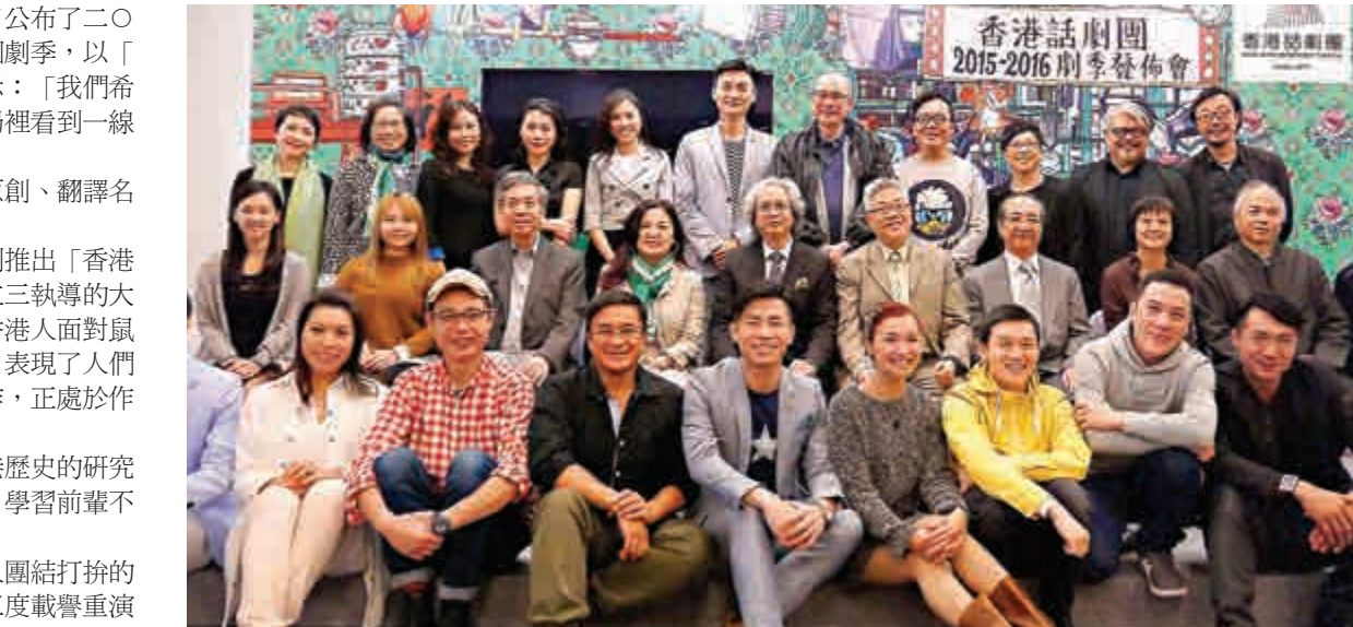
▲香港話劇團導演、編劇與眾演員合影