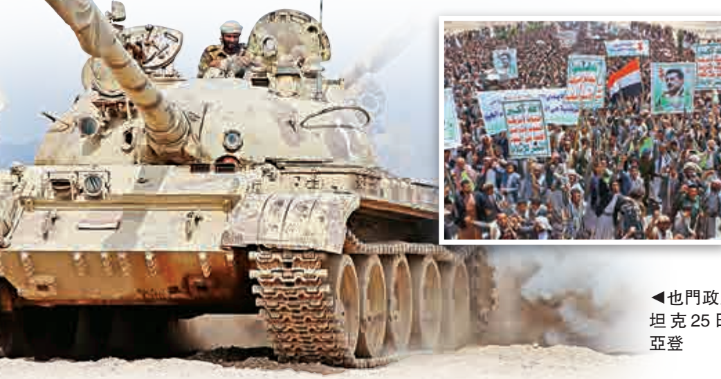
▼也門政府軍的坦克25日開進亞登