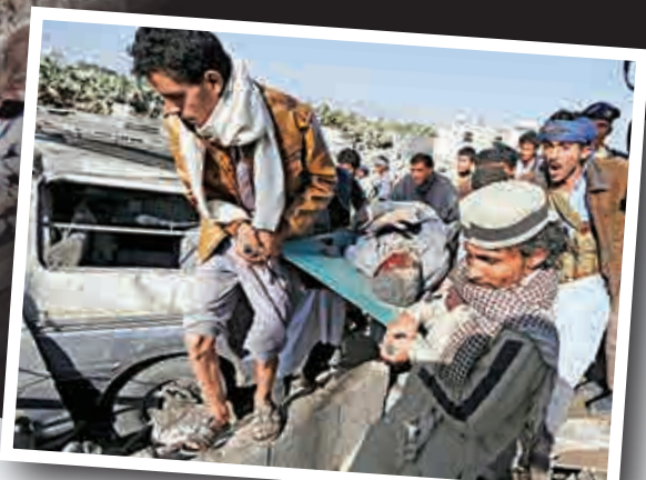
▼薩那民眾將一具遺體從瓦礫中抬走

以史為鑒不難發現，外國插手只會讓本已處在混亂中的國家變得更糟。弔詭的是，現在沙特與埃及試圖軍事進入也門，這與上世紀60年代也門發生衝突時，兩國插手的情形很像。沙埃的入侵讓北也門的情況變得更加糟糕。這並不意味這外國勢力不能幫助也門渡過困難時期，但任何一個想把也門的戰亂當成自己的戰爭來打的國家，最終都不可能吃到什麼好果子。