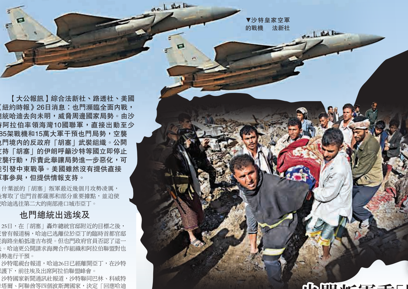
▼沙特皇家空軍的戰機