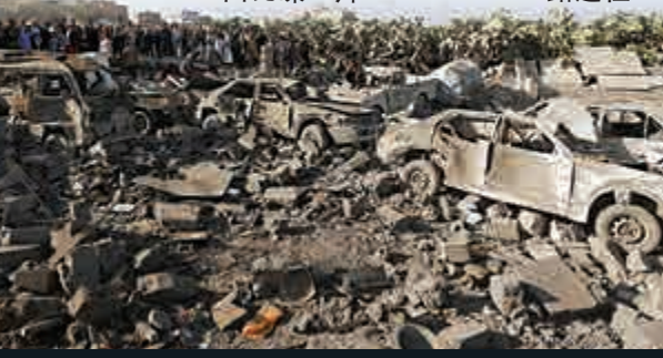
▼也門薩那機場被轟炸之後，地面瓦礫一片

伊朗26日對空襲行動表示譴責，稱沙特這一「危險舉動」或將令也門危機「進一步複雜化」，呼籲立刻停止空襲，引發區域內危機。伊朗外交部表示，沙特對「胡塞」的轟炸「違背了尊重別國主權的國際責任」，這一舉動只會導致該地區平民的喪生以及激進主義的擴張。