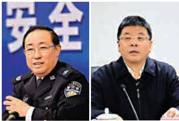
▲傅政華任公安部副部長、黨委副書記 資料圖片 ▲鄧衛平任公安部紀委書記 資料圖片

【大公報訊】據中國經濟網報道：公安部官方網站「領導信息」欄目顯示，傅政華已任公安部副部長、黨委副書記（正部長級），副總警監警銜。而劉金國不再擔任公安部黨委副書記、副部長、紀委書記職務。另外，鄧衛平任公安部紀委書記、黨委委員。 傅政華，1955年生，原任公安部副部長，北京市委常委，市公安局黨委書記、局長。近日，河南省副省長、省公安廳廳長王小洪已接替傅政華出任北京市公安局局長一職，傅政華亦卸去北京市委常委職務。