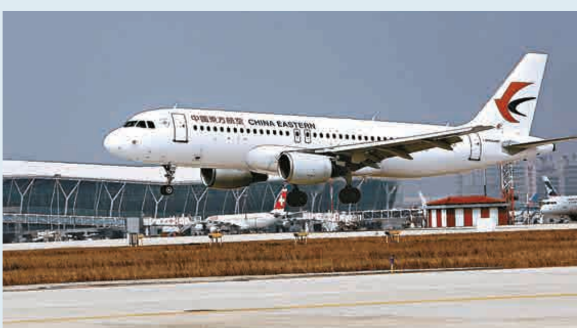
▲28日，一架商業航班準備在浦東國際機場新啓用的第四跑道降落

另悉，目前浦東機場正在建設第五跑道，未來其將成為國產大飛機的試飛跑道。第五跑道位於建成後的第四跑道以東1750米處，長3400米、寬45米，運行等級為4E級，可供除A380外的所有飛機起降。