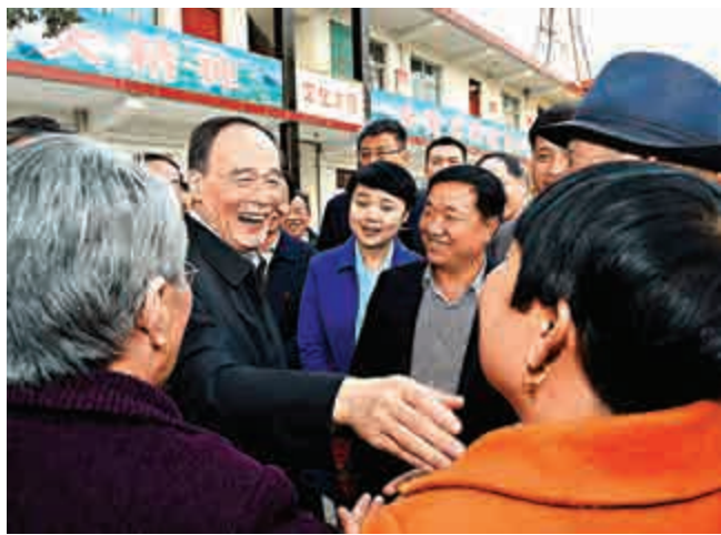
▲27日，王岐山與河南林州姚村鎮馮家口村村民親切交談