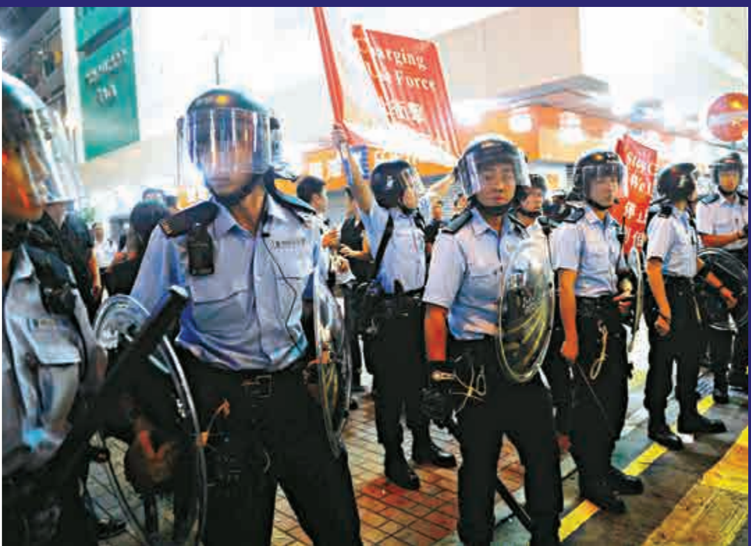
▲保安局就新年度財政預算回覆立法會財委會表示，去年「佔中」期間耗費的大量公帑計數，警方為應付「佔中」的總支出約為3.5億元 資料圖片