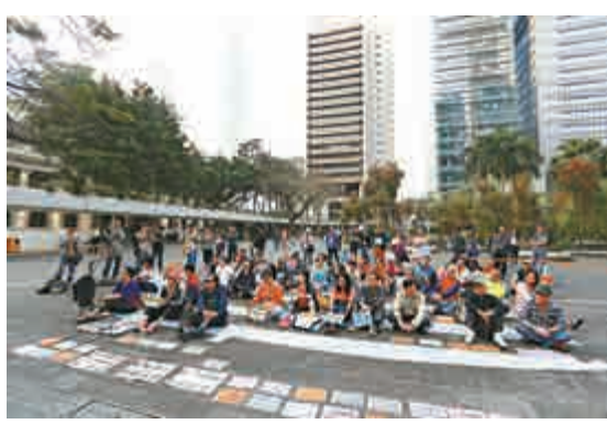
▲網上團體「光復香港」昨日舉行「支持反『佔中』，我要真法治」集會

參與集會的Sandy表示，「佔領人士做咁多犯法事都無一個人要坐監」，她批評佔領行動人士「唔認輸」，她稱自己在港生活五十多年，見證香港發展。她指出，回歸前根本「無人敢鬧港督」，但現在的人「開口埋口就鬧特首」、「又對特首擲物品」，形容