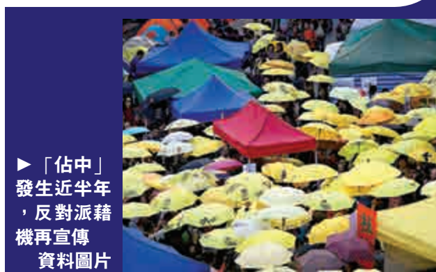
▲「佔中」發生近半年，反對派藉機再宣傳 資料圖片

警方重申，處理公眾活動時會因應個別活動的目的、性質、參與人數、過往處理同類活動的策略及經驗等，作全方位的風險評估及考慮，從而規劃整體策略及應變方案，以決定須調配的人手和應採取適當的人群管理措施，確保該活動能安全有序地進行，惟警方所調配的警力及資源屬行動部署細節，不便披露。未來一段日子，警方表示繼續留意事態發展，透過適時調配內部人手及資源，加強各區部署及防範，不會容忍任何擾亂社會秩序及違法的行為。