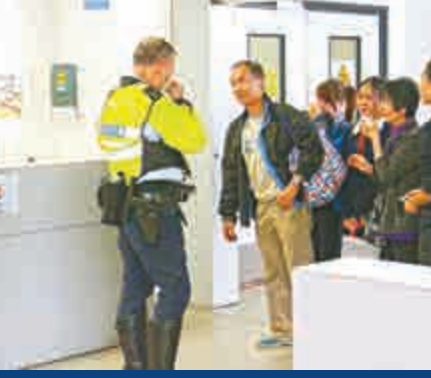
▼涉事小巴司機被拘捕帶署扣查