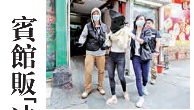
▲涉嫌販毒女子被探員押走