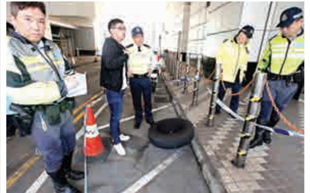
▲車輪撞及停車場出入口牆壁後墮地