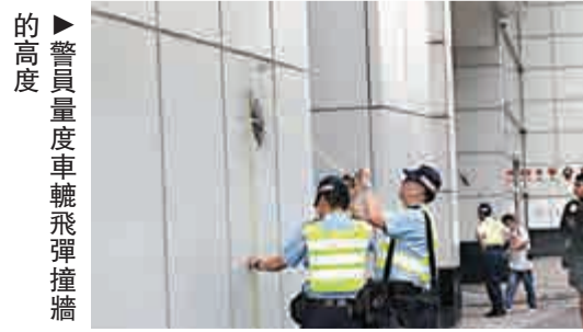
▶警員量度車輪飛彈撞牆的高度

同類意外在前年亦發生，2013年12月13日，泥頭車在大角咀西九龍走廊行駛時左前車輪螺絲突然鬆脫，重200磅的巨輪甩脫彈而出，飛越天橋路旁石壁，凌空飛墮30米下橋底的大角咀道行人路，擊中七名男女途人。