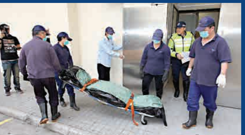
▲女廚師遺體由件工昇送殮房