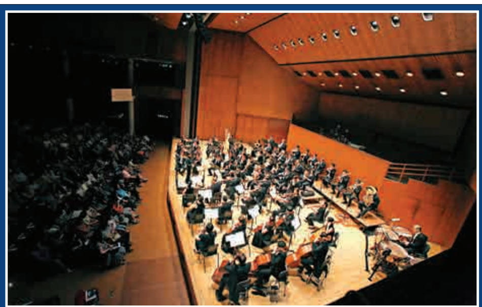
▲香港小交響樂團將於本月中在大會堂演出

演出門票現已於城市售票網發售，有關演出詳情可瀏覽網址： www.hkso.org 或致電：二八三六三三三六。