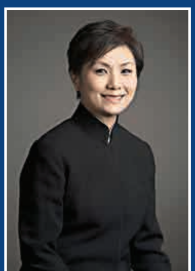
▲葉詠詩將帶領樂團演奏貝多芬第七交響曲，以及西貝遼士《戀人組曲》