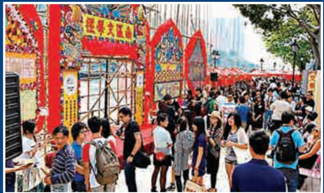
▲香港文學館「我街道·我知道·我書寫」計劃，以香港十八區為主題