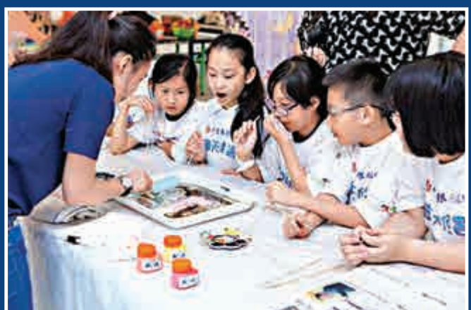
▲研究進行式「捉字室」帶領中學生運用歷史、地理、藝術科目等形式，發掘啟德社區的歷史和環境