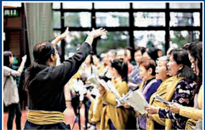
▲社區文化發展中心通過「飲茶作樂——深水埗之生命儀式」，讓大家尋找屬於自己的深水埗身份