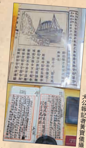
▲上圖為《共和國教科書》中國文並茂的鐵達尼郵船沉沒課文，下圖為晚清時期的學生作文《說運動》 大公報記者黃寶儀攝

另一套商務印書館發行的小學國文教材是民國期間當時教育部審定的《初等小學校新國文》，語文第一課之前特別註明「民國學校不分男女，本書兼收女子教材，以便男女共學之用」，證明此時期社會對女子的限制已經大大減少，男女不僅可以一起學習，就連學習內容也趨向一致。更加讓人驚喜的是，當時的教材