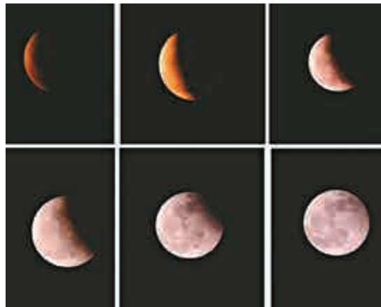
4月4日是清明假期第一天，月全食現身中國各地天宇。圖為當晚在山東省濟南市拍攝的月食過程。