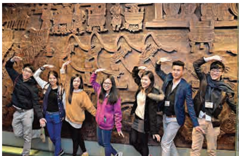
▲港澳青年尋根謁祖團團員在陝西歷史博物館合影

在博物館入口大廳處，導遊向港澳青年介紹說：「館區佔地65000平方米，館藏文物多達370000餘件，上起遠古人類初始階段使用的簡單石器，下至1840年前社會生活中的各類器物，時間跨度長達100多萬年。文物不僅數量多、種類全，而且品位高、價值廣，其中商周青銅器精美絕倫，歷代陶俑千姿百態，漢唐金銀器獨步全國，唐墓壁畫舉世無雙。可謂琳琅滿目、精品薈萃。」