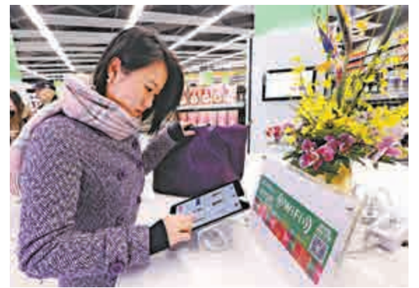
▲消費者在上海自貿區首家O2O體驗店登陸網站預訂商品 資料圖片

【大公報記者夏微上海八日電】上海市政府和浦東新區政府官網8日更新信息顯示，上海市委常委、副市長艾寶俊出任中國（上海）自由貿易試驗區管委會黨組書記、主任；上海市委常委、浦東新區區委書記沈曉明出任中國（上海）自由貿易試驗區管理委員會主任。自此，滬自貿區管委會開啓「雙主任」領導模式。