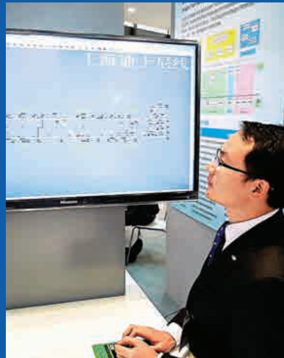
▲工作人員演示滬地鐵迪士尼線的信號控制系統

該系統不僅可幫助地鐵系統實現最大旅客吞吐量，得益於先進架構，亦可不局限於固定線路運行方向，提供安全的「雙線雙向」運營功能，從而具備最大的運營靈活性。這些優勢在上海世博會期間得到充分體現。