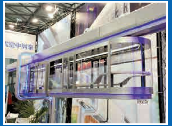
▲上海「空中列車」考慮採用全透明車廂 網絡圖片

精度高：全自動，定位精度3厘米 噪音少：距離6.5米處小於65分貝 耗電少：不到地鐵耗電50%