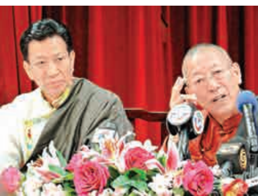
▲西藏自治區人大常委會副主任新雜·單增曲扎（右）在三藩市介紹西藏社會經濟發展現狀

新雜·單增曲扎說，「我們都是土生土長的西藏人大代表，對西藏的社會經濟發展狀況最有發言權。」他表示，此行將向美國社會介紹最真實的西藏，增進相互了解。