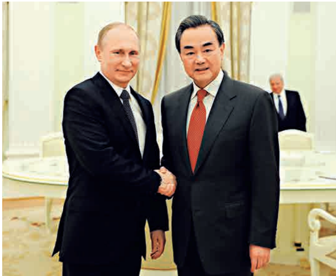
▲普京會見王毅時表示，俄方熱切期待習近平主席訪俄

王毅說，兩年多來，習近平主席和普京總統從中俄兩國發展振興的大局着眼，從世界和平與發展的大勢出發，對中俄關係進行頂層設計，戰略引領，推動中俄全面戰略協作夥伴關係保持高水平運行並進入新的發展階段。中俄雙方相互尊重、相互支持、互利合作、共同發展，為大國間交往提供了有益經驗，成為構建新型國際關係的成功實踐。為應對國際地區形勢的新變化，中俄雙方應把絲綢之路經濟帶構想同跨歐亞大通道建設以及歐亞經濟一體化進程相互對接，拓展新的合作領域，搭建新的合作平台。繼續加強人文交流，夯實兩國友好的民意和社會基礎。雙方還應以紀念二戰勝利70周年為契機，加強在國際事