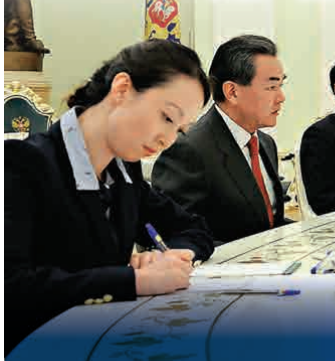
▼俄羅斯總統普京（右二）7日在克里姆林宮會見中國外交部長王毅（左二）

【大公報訊】7日下午，俄羅斯總統普京在莫斯科克里姆林宮會見中國外交部長王毅。王毅表示，兩年多來，習近平主席和普京總統對中俄關係進行頂層設計，戰略引領，推動中俄全面戰略協作夥伴關係保持高水平運行並進入新的發展階段。為應對國際地區形勢的新變化，中俄雙方應把絲綢之路經濟帶構想同跨歐亞大通道建設以及歐亞經濟一體化進程相互對接，拓展新的合作領域，搭建新的合作平台。