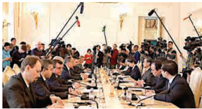
▲王毅與俄羅斯外長拉夫羅夫在莫斯科舉行會談