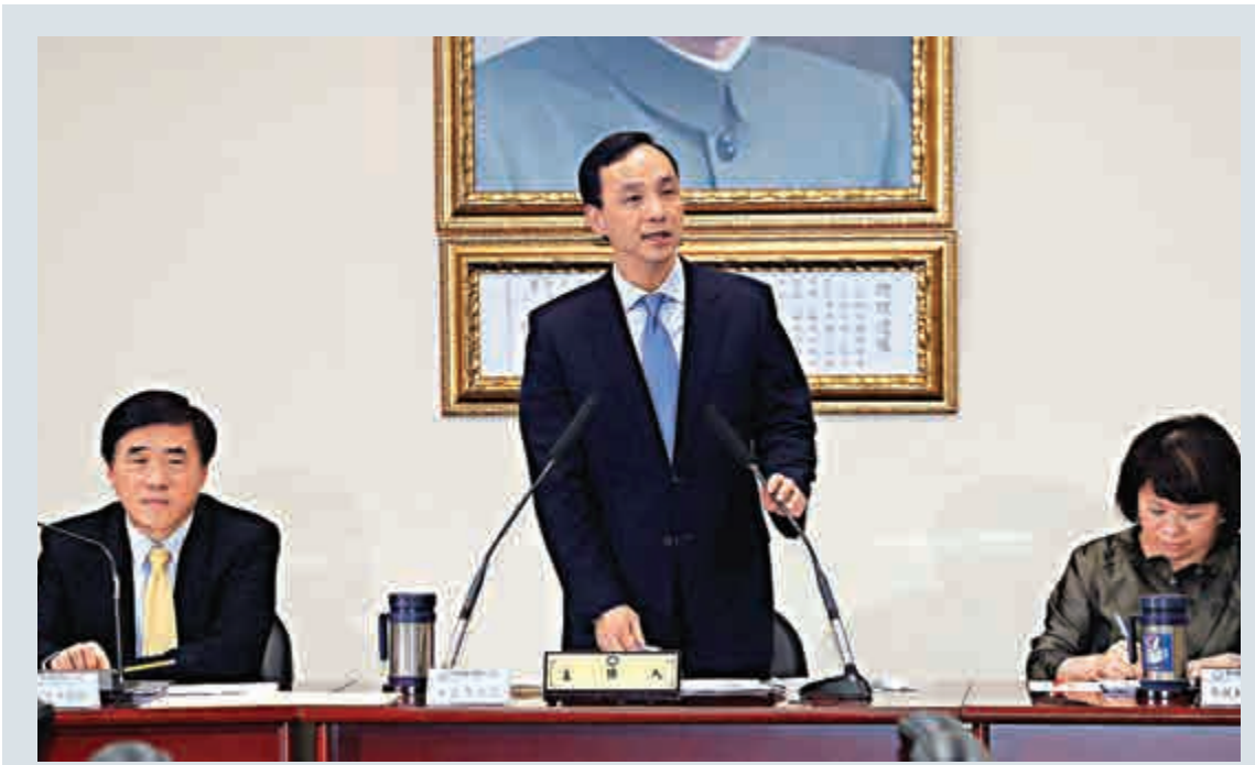
▲國民黨主席朱立倫（中）下月將率團登陸參加第十屆兩岸經貿文化論壇 資料圖片

8日還出現「借廁所」怪象，平鎮警局白天不時有民眾問「能不能借廁所？」一家擔仔麵店劉姓老闆娘也說，以往客人用餐完就走，現在都先上過廁所才結帳，水用得少，衛生紙也用很快。龍潭有自助洗衣店貼出公告「請不要在周三、周四送洗，以免中途沒水」。