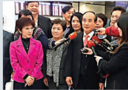
▲「立法院長」王金平9日結束訪日行程，搭機返抵台灣接受訪問。「立法院副院長」洪秀柱（左）到場接機

國民黨中常會日前通過「第14任總統副總統選舉總統候選人提名作業時程暨作業要點」，4月20日到5月16日進行領表和黨員連署。