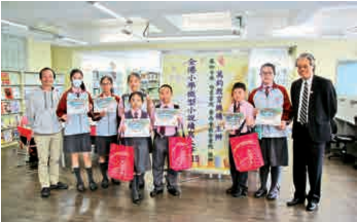
▲「全港小學微型小說續寫大賽2015」已於3月28日上午假匯知中學禮堂順利舉行

經過初步評審後，作品最終交由終審評判華文微型小說學會會長、香港兒童文藝協會會長東瑞、著名兒童及青少年作家君比、圓桌詩社社長秀實、香港城市大學中文及歷史學系副教授王培光以及嶺南大學中文系助理教授陳惠英評定冠、亞、季、殿及優異作品，相關獎項將於4月26日「匯知文化祭暨學校開放日2015」的綜合匯演揭曉。