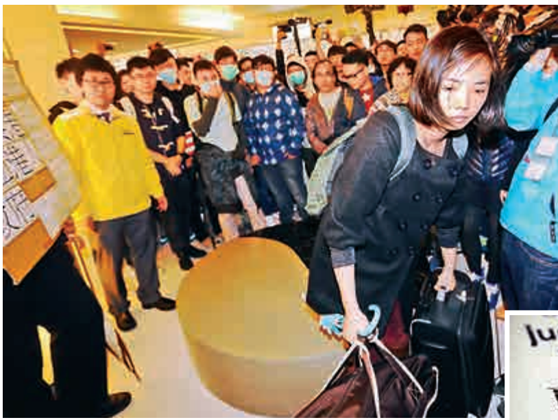
▲近來一些所謂的反水客活動已經失控，不少被激進分子影響的年輕人並沒有慎思明辨，便做出不少辱客行為，標籤他人，簡單地把人歸類

面對問題時，提醒自己，不要情緒化地以為自己已經擁有真理，要敢於面對新證據、資訊、新的角度，願意修正想法。不要感情用事，死纏在一點