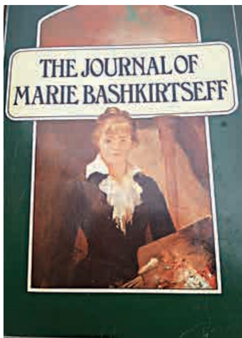
巴什基爾采娃日記英譯本